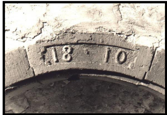
1810, Türsturz an der Scheune. 6