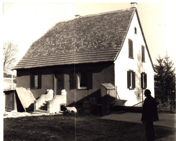
1979, Eulenmühle. 7