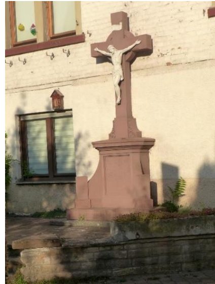
Straßenkreuz an der Backhausstraße. 36

Danach strebte man durch die Untergasse dem Straßenkreuz in der Backhausstraße zu.