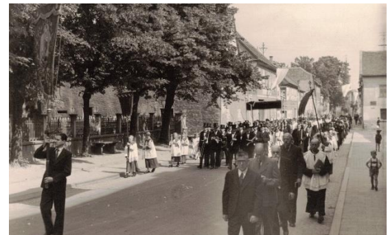
1950er Jahre, Fronleichnamsprozession in der Pariser Straße, links der noch eingefriedete Kirchhof. 43

Aus den 1950er Jahren sind auch Flurprozessionen zum Feldkreuz oberhalb der Mittleren Ecklochermühle , heute Kreuzhof, bekannt.