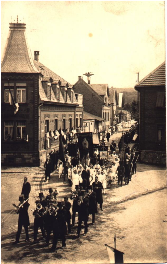
1920er Jahre, Fronleichnamprozession, Ecke Wallstraße-Bahnhofstraße. 34

Der Weg führte weiter durch die Domherrnstraße, die Wallstraße hinunter zum Straßenkreuz an der Ecke Oppenheimer Straße und Wilhelm-Holzamer-Weg.