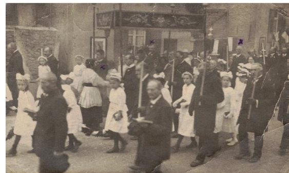
1920er Jahre, Fronleichnamprozession. 37

Oh, gekreuzigter Heiland erbarme dich deiner Völker. Inscription auf dem Sockel: Errichtet im Kriegsjahr 1916.