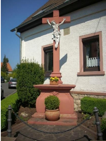
Das Straßenkreuz mit der Inschrift 1776 befand sich früher am Haus Pariser Straße Nr. 80 und wurde später an die Ecke Kreuzstraße-Leherweg versetzt. 39

Dann die Backhausstraße hoch, entlang der Pariser Straße zum Straßenkreuz an der Kreuzstraße. Das Kreuz stand damals noch an der Ecke Pariser Straße-Kreuzstraße und wurde 1955 an den heutigen Standort versetzt. Von dort ging es wieder zurück zur Pfarrkirche.