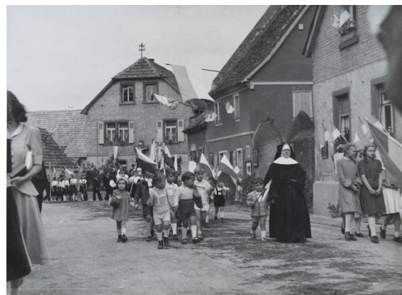
1950er Jahre, Fronleichnamprozession in der Backhausstraße, mit dabei die Kinder des kath. Kindergartens, Pfarrgasse, betreut von Nonnen der Göttl. Vorsehung. 38