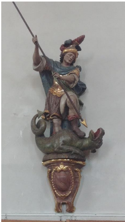
Skulptur von St. Georg, Titularheiliger der Kirche. 22

Über die feierliche Prozession am Kirchweihmontag, wie sie bis zum Ende des 18. Jahrhunderts durchgeführt wurde, sind keine Nachrichten mehr zu finden. Erhalten hat sich der feierliche Dankgottesdienst am Kirchweihsonntag, wie er noch heute begangen wird.