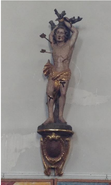
Skulptur des St. Sebastian in der kath. Pfarrkirche. 5