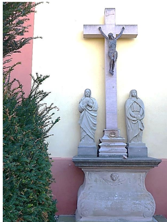
Kreuzigungsgruppe von 1773. 61