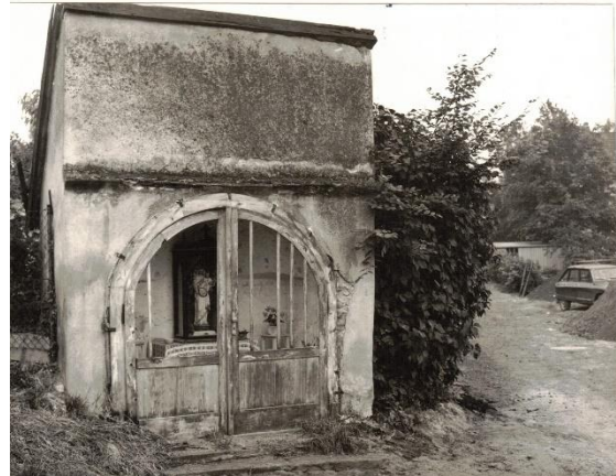
1979, ruinöser Bauzustand. 49

"...an das Heiligen Häuschen nächst der Wingertsmühl..." 48