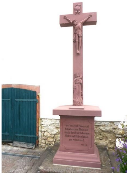
2021, Strassenkreuz mit dem Relief der Hl. Katharina. 29 Inscription:

Von der Kirche die Pfarrgasse hoch zum Strassenkreuz an der Ecke Pfarrgasse und Domherrnstraße.