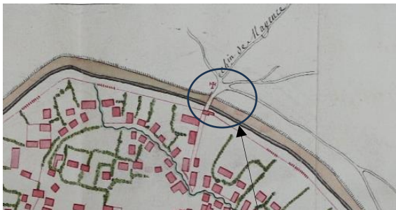
1735, die Kapelle am Mainzer Tor wurde mit einem Kreuz markiert. 59

Kreuzstraße, weiter zum Heiligenhäuschen an der Wingertsmühle. Die Kapelle musste wohl 1806 dem Bau der Pariser Straße weichen, dem auch die Mainzer Pforte zum Opfer fiel.