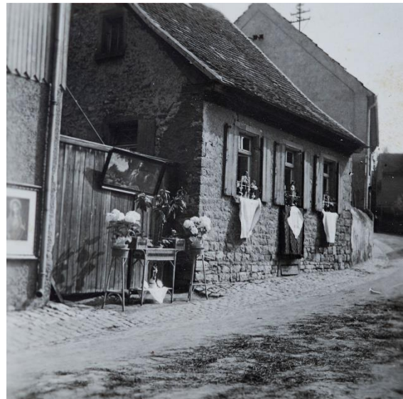
1950er Jahre, Fronleichnamprozession. Das geschmückte Haus der Familie Stohr in der Pfarrgasse Nr. 12. Im Vordergrund der gestreute traditionelle Grastepich auf der Straße. 33