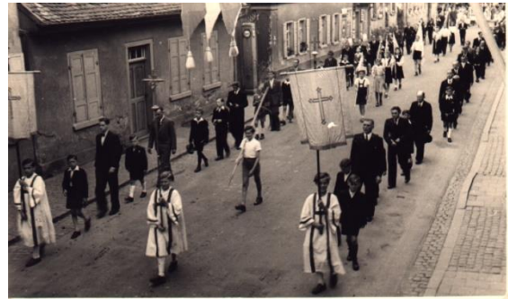
1949, Fronleichnamsprozession in der Pariser Straße. 42

Geierschellerweg, dem Leherweg, auf der Pariser Straße zurück zur Kirche. 41