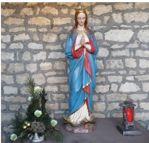
Das 1979 sanierte Heiligenhäuschen Am Woog. 54