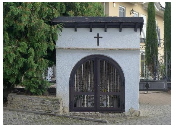
Heutiger Bauzustand. 50

Inzwischen hat sich die Zuständigkeit geklärt und sie liegt nunmehr in Händen der katholischen Kirchengemeinde Nieder-Olm.