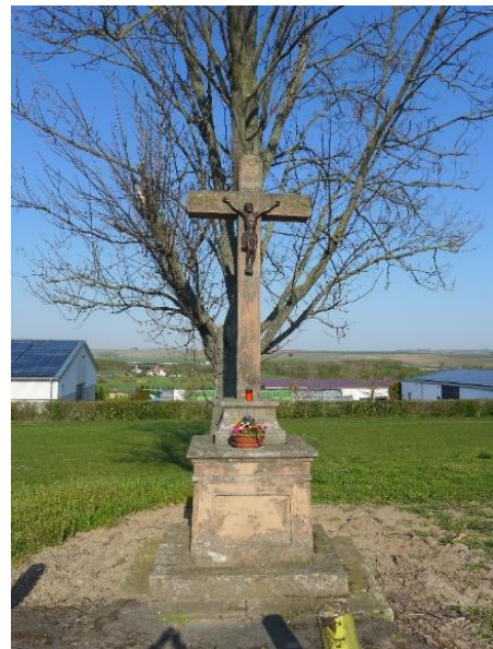
Flurkreuz oberhalb des Kreuzhofs an der Oppenheimer Straße. 44

Aus den 1950er Jahren sind auch Flurprozessionen zum Feldkreuz oberhalb der Mittleren Ecklochermühle , heute Kreuzhof, bekannt.