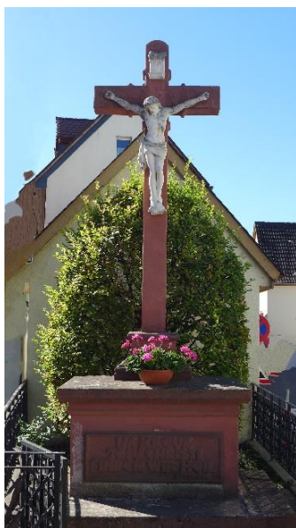
Straßenkreuz an der Oppenheimer Straße. 35 Inscription: Im Kreuz Jesus Christi finden wir unser Heil.