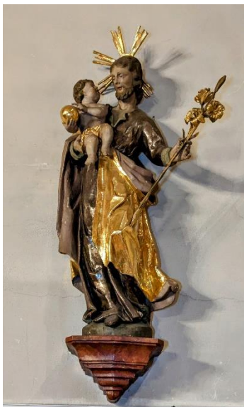
Skulptur des St. Josef in der kath. Pfarrkirche. 8