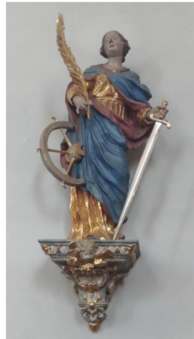
Skulptur der Heiligen Katharina in der Pfarrkirche Nieder-Olm. 26

"Catharinae gehet man mit der procession cum venerabile sacramento umb die kirchen". 25