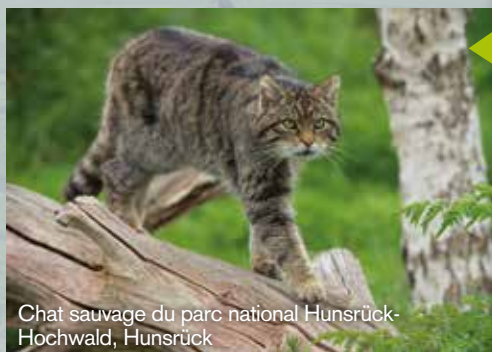
Chat sauvage du parc national Hunsrück-Hochwald, Hunsrück