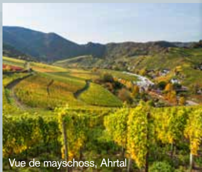
Vue de Mayschoß, Ahrtal

..., que la plus ancienne cave coopérative du monde est basée à Mayschoß et fut couronnée la meilleure cave coopérative d'Allemagne ?