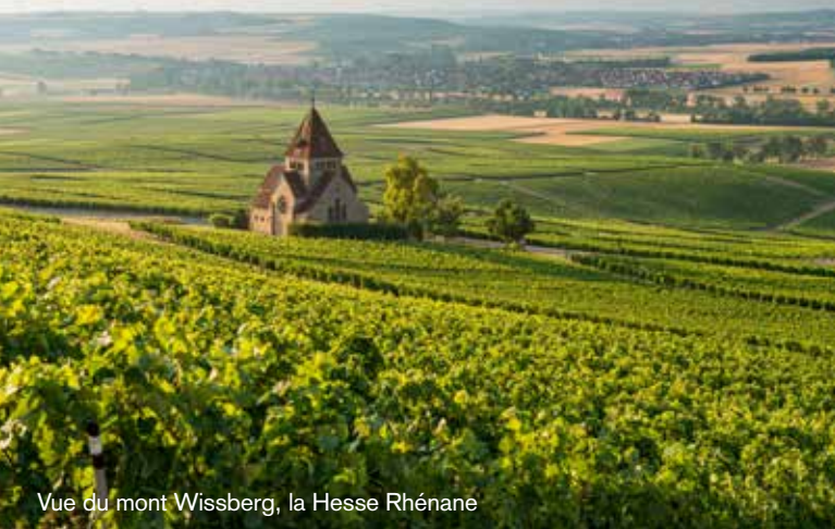
Vue du mont Wissberg, la Hesse Rhénane