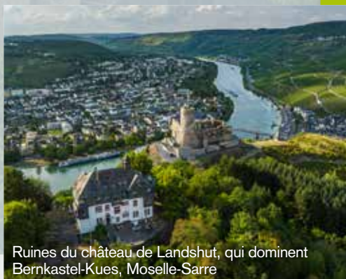
Ruines du château de Landshut, qui domine Berncastel-Kues, Moselle-Sarre