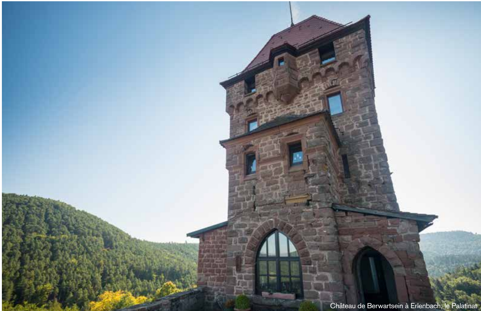
Château de Berwartsein à Erlenbach, le Palatinat