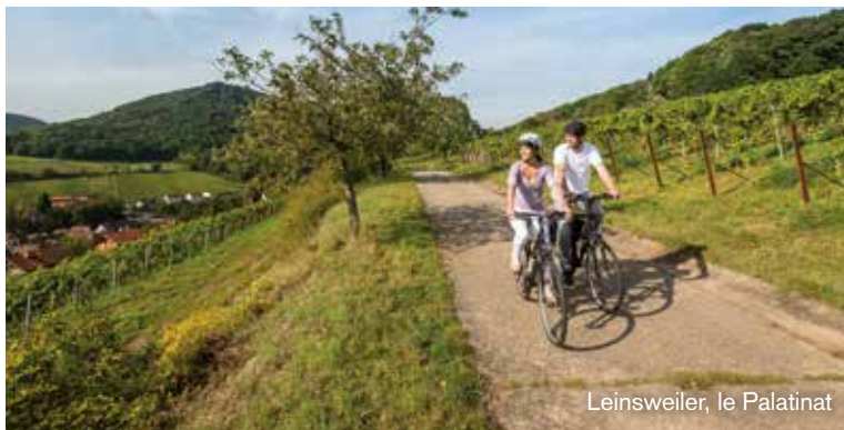
Leinsweiler, le Palatinat

La Rhénanie-Palatinat est une excellente région cycliste proposant un large éventail de pistes cyclables bien balisées. Au total, elle offre un réseau de 8 000 kilomètres à la qualité reconnue dont sept pistes cyclables et plus de 60 itinéraires à thèmes disponibles. Les cyclistes amateurs de confort, peuvent se laisser glisser le long des rivières ou fleuves Ahr, Lahn, Moselle, Nahe et Rhin et profiter des différents paysages viticoles tout en pédalant. Les cyclistes plus sportifs et ambitieux en auront pour leur argent dans les paysages boisés des massifs basse montagne de l'Eifel, du Hunsrück, Pfälzerwald (littéralement « forêt palatine ») et du Westerwald.