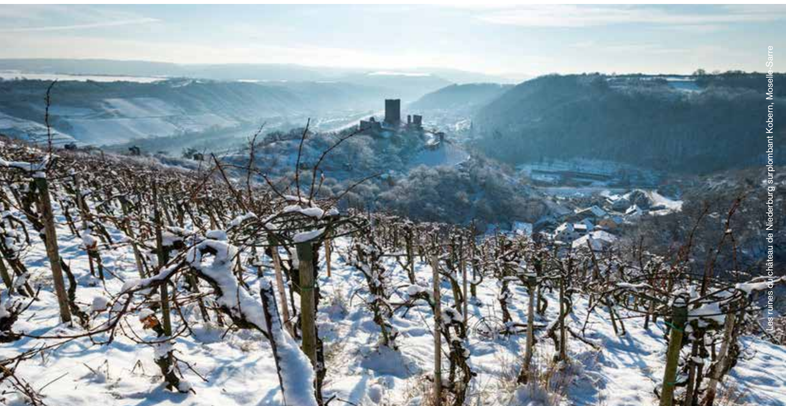
Les ruines du château de Niederburg surplombant Koblenz, Moselle-Sarre

18/04/2021 au musée régional de Mayence, répond exactement à ces questions. Cette collection fascinante de pièces uniques met en lumière les réseaux dynamiques que les empereurs et les rois, les chevaliers et les princes, les bourgeois et les villes entretenaient.