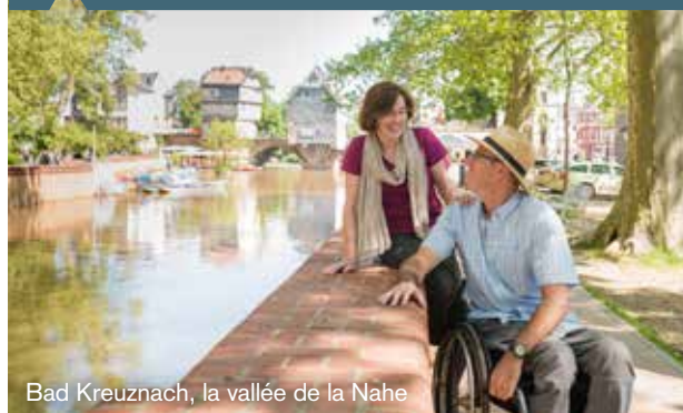
Bad Kreuznach, la vallée de la Nahe