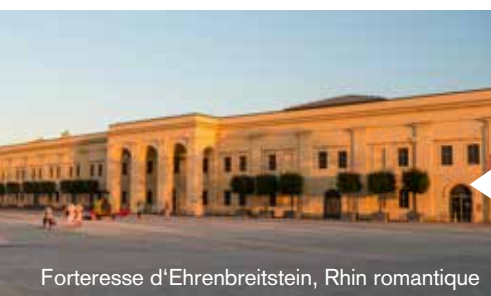
Forteresse d'Ehrenbreitstein, Rhin romantique

Aucune autre région en Allemagne n'offre une telle densité de ruines hautes, de magnifiques châteaux et de châteaux de conte de fées. Des histoires issues d'un passé lointain et une atmosphère presque magique font de la visite de ces témoignages historiques une expérience inoubliable : par exemple le château fort de Trifels, où le roi Richard Coeur de Lion fut un temps emprisonné, la Forteresse d'Ehrenbreitstein à Coblenche ou le château médiéval Marksburg, le seul château du Haut-Rhin moyen qui a échappé à la destruction.