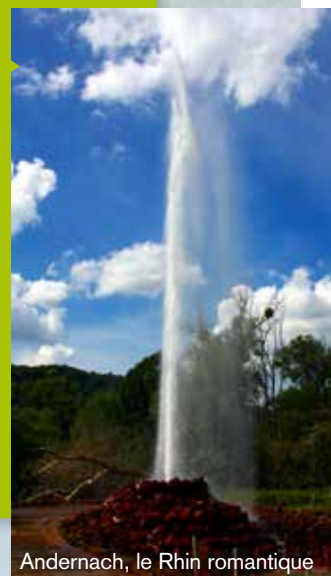
Andernach, le Rhin romantique

..., que le Westerwald propose une offre exceptionnelle pour la pratique de la randonnée ? (étape 10 WesterwaldSteig). Un pas sûr et l'absence de vertige est nécessaire pour s'aventurer sur ce magnifique sentier qui traverse la plus belle partie du parc naturel « Kroppacher Schweiz ».