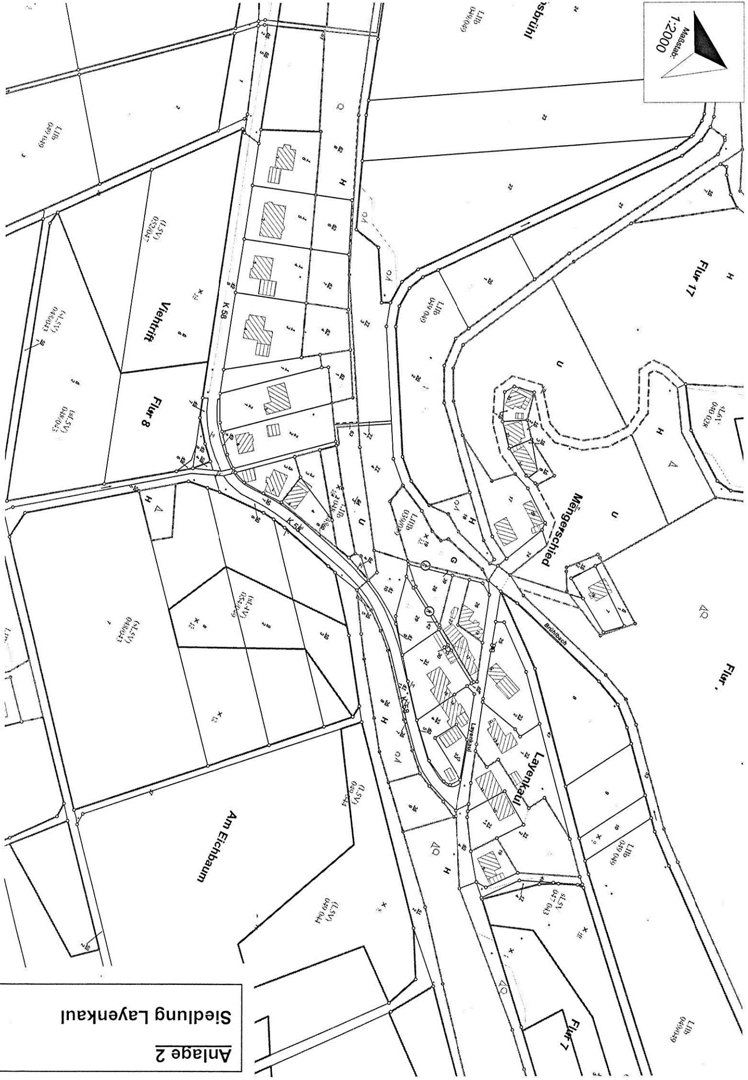
Anlage 2 Siedlung Layenkaul