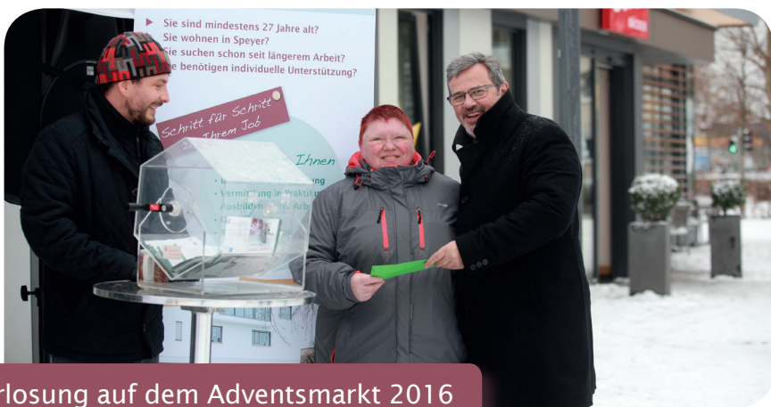
Verlosung auf dem Adventsmarkt 2016

Mit dieser letzten Ausgabe der BIWAQ-News wird der Blick noch einmal auf die kleinen und großen Ereignisse während des Projekts gelenkt. Gemeinsam wurde durch viel Engagement etwas bewegt! An alle Projektbeteiligten, Teilnehmenden, ehrenamtlichen Helfern und Kooperationspartnern daher an dieser Stelle: Vielen Dank für die gute Zusammenarbeit!