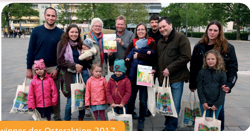
Gewinner der Osteraktion 2017