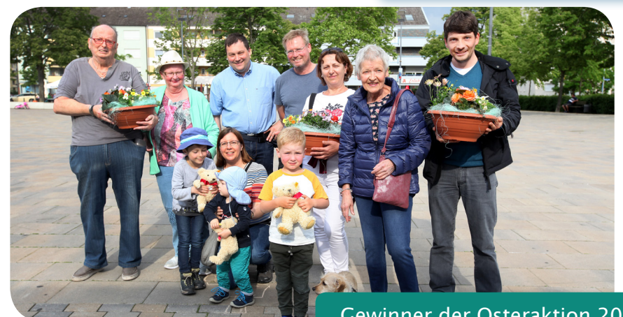
Gewinner der Osteraktion 2018

Das Projekt „Dienstleistungszentrum Speyer-West – Soziale Teilhabe in sinnvollen Jobs“ wird im Rahmen des ESF-Bundesprogramms „Bildung, Wirtschaft, Arbeit im Quartier – BIWAQ“ durch das Bundesministerium für Umwelt, Naturschutz, Bau und Reaktorsicherheit und den Europäischen Sozialfonds gefördert.