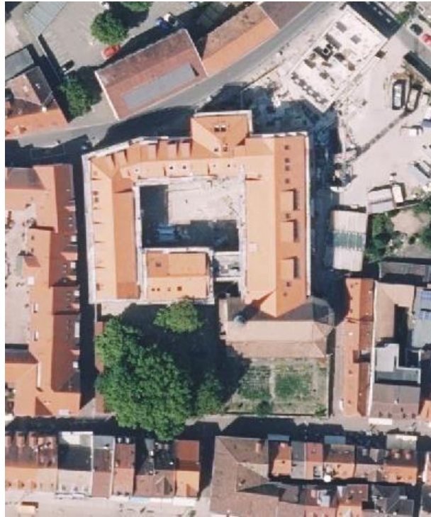
Wohnanlage und Kirche des ehemaligen Konvikts Bistumshaus St. Ludwig zwischen Korngasse und Großer Greifengasse.