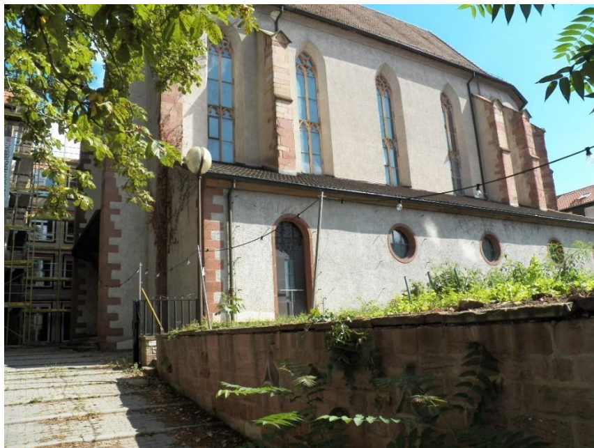
Ehemalige Kirche St. Ludwig. Verbliebener Chor der 1689 zerstörten Dominikanerkirche mit südlicher Erweiterung von 1935 (Architekt Alfred Boßlet).