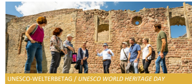
UNESCO-WELTERBETAG / UNESCO WORLD HERITAGE DAY

The superlative technology festival transforms the grounds into a gigantic playground for technology fans and petrolheads. The programme includes fire-breathing giants of displacement, impressive show rides and exciting adventure tours.