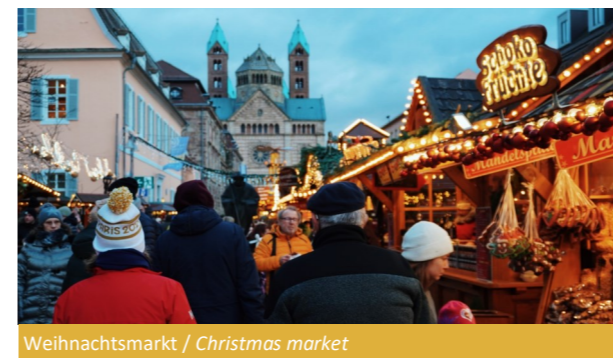
Weihnachtsmarkt / Christmas market

Many attractions and innovations guarantee a variety-filled stroll for the whole family.