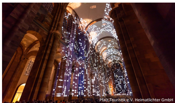
Pfalz.Touristik e.V. Heimatlichter GmbH

Vendors from the Palatinate region present their premium-quality self-grown products as well as country arts and crafts. Take the chance to taste some of the regional specialties.