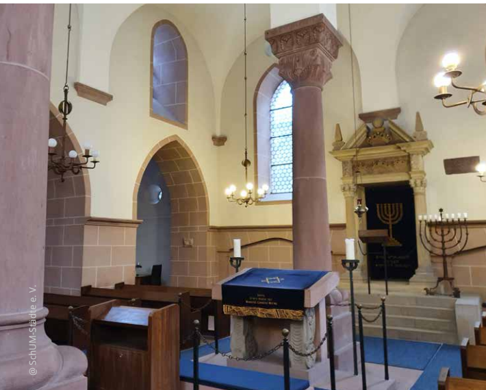
Innenraum Wormser Synagoge

SchUM ist Architektur, Religion, Gelehrsamkeit. SchUM sind 1000 Jahre jüdische Geschichte!