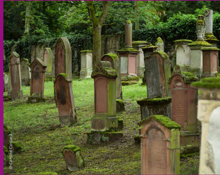
Alter jüdischer Friedhof „Judensand“, Mainz

Die SchUM-Stätten Speyer, Worms und Mainz sind sichtbares, einzigartiges jüdisches Erbe – und UNESCO-Welterbe!