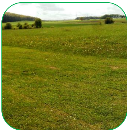
Eine teilflächig gemähte öffentliche Wiese, um Insekten zu schützen.

Für einen naturnahen Garten ist es wichtig, nicht zu häufig zu mähen. Ideal wäre eine jährliche Mahd im September. Will man häufiger mähen, sollte man mit der ersten Mahd bis Juni warten, damit einige Pflanzen blühen können. Um den Garten durchgehend für Insekten attraktiv zu halten, bewährt sich eine teilflächige Mahd. So bestehen das ganze Jahr über Wiesenflächen, die für Blütenbesucher nutzbar bleiben.