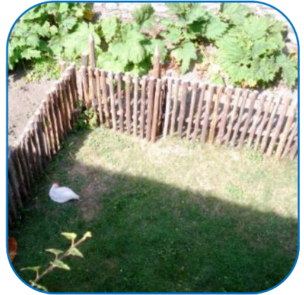
Das Huhn weiß ein schattiges Plätzchen zu schätzen.

Des Weiteren gilt es, die Lichtverhältnisse im Garten herauszufinden. Dazu beobachtet man ganz einfach den Garten im Tagesverlauf und hält im Blick, welche Orte durchgehend sonnig, teils sonnig und teils schattig und komplett schattig sind. Dies ist nicht nur für Pflanzen ausschlaggebend, sondern zeigt auch auf, wo man z.B. Insekten-Nistkästen (eher sonnig) aufstellen oder einen Teich (eher schattig) anlegen sollte.