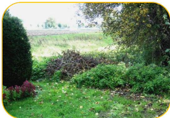
Ein kleiner Reisighaufen neben ein paar Brennnesseln am Rand eines Gartens

Bilden sie Reisig- oder Laubhaufen an einem geschützten Ort, siedeln sich dort gerne Igel und Spitzmäuse zum Überwintern an. Diese sind nicht nur schön zu beobachten, sondern fressen auch große Mengen an Schnecken, Larven, Käfern und anderen unliebsamen Insekten.