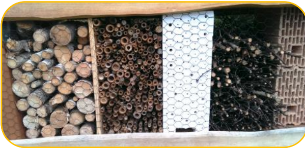
Ein kleiner Ausschnitt des großen Insektenhotels der Stadtgärtnerei Speyer

Viele Insekten siedeln gerne in vorhandenen Hohlräumen. Um diese zu fördern, kann man ganz einfach eigene Insekten-Nistkästen aus Holz bauen. Dabei sollte man auf folgendes achten: