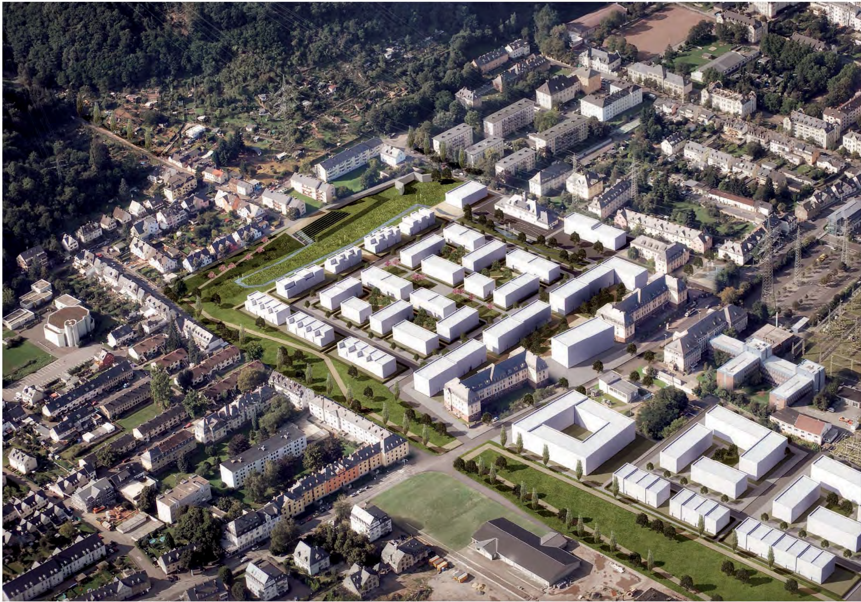
„Vom Lenus-Mars Tempel zur Mosel“ Schematische Perspektive