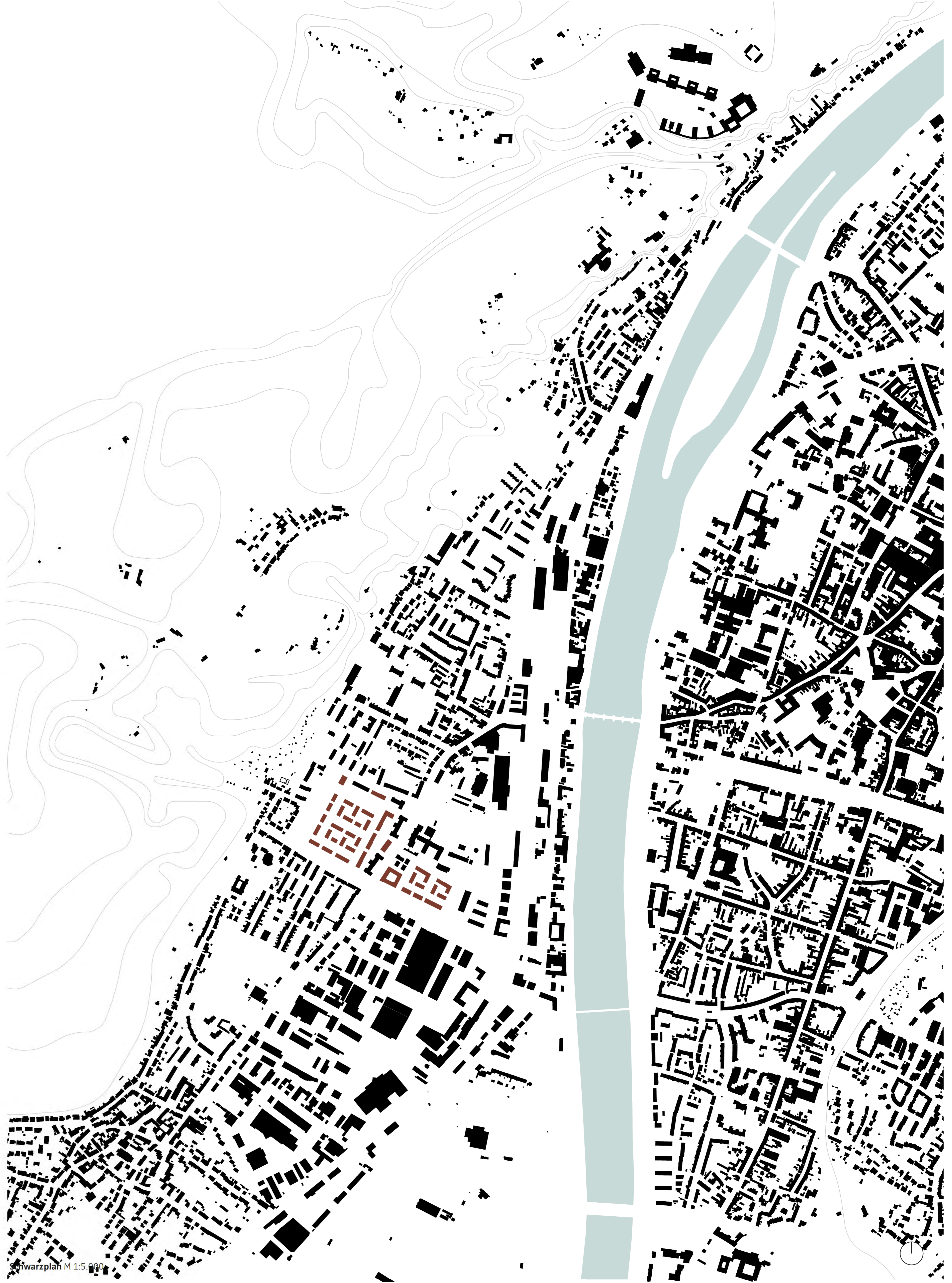
Siteplan M 1:5.000

Die Qualität des Ortes wird durch einen hohen Wiedererkennungswert, eine klare, kompakte und kostengünstige Struktur und eine Kontinuität der Stadtstruktur geprägt. Hochqualitative und vielfältige Gebäude-, Wege- und Freiraumstrukturen schaffen eine spannungsvolle Abfolge attraktiver Räume mit hohen Aufenthaltsqualitäten.