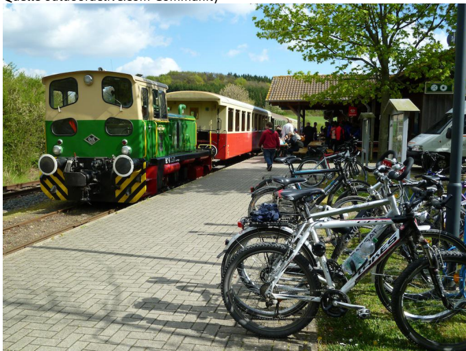
Am Bahnhof Engeln beginnt die kurze Radtour auf der ehemaligen Bahntrasse nach Kempenich. Autor Michael Hergarten Quelle outdooractive.com-Community