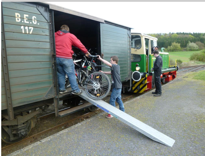
Ausladen der Fahrräder aus dem "Vulkan-Expreß".