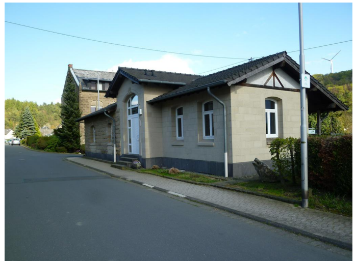
Das ehemalige Bahnhofsgebäude von Weibern wird heute als Steinmetzmuseum genutzt. Autor Michael Hergarten Quelle outdooractive.com-Community