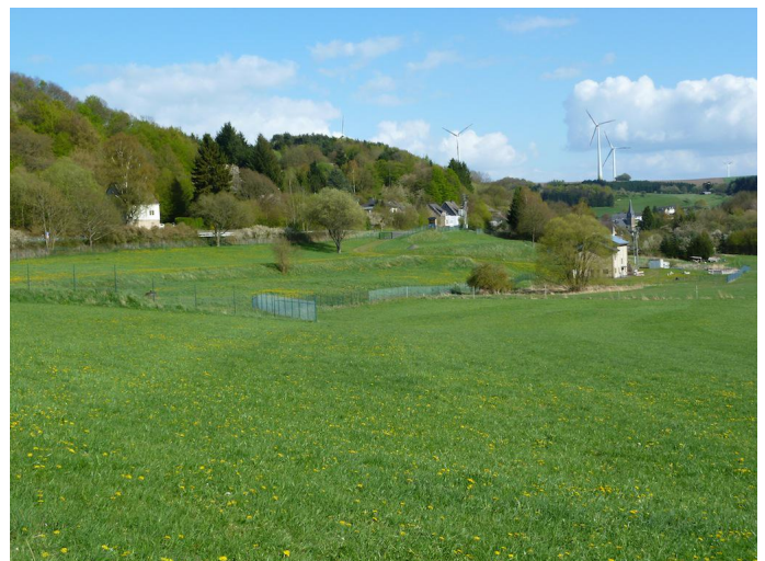
Blick zurück auf Weibern von der alten Bahntrasse in Höhe des Freizeitbades.