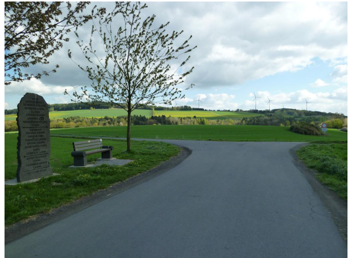
Auf dem Brohltal-Radweg zwischen Engeln und Weibern.