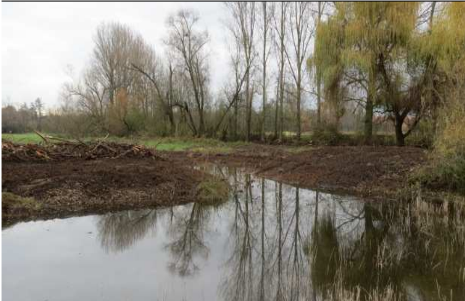
Im Jahr 2017 durch die Kreisverwaltung Germersheim (UNB) umgestalteter Fischteich