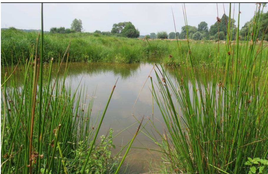
Durch die POLLICHIA-Ortsgruppe im Jahr 2015 umgestaltete, Fischzuchtanlage mit bereits eingegrüntem Ufern