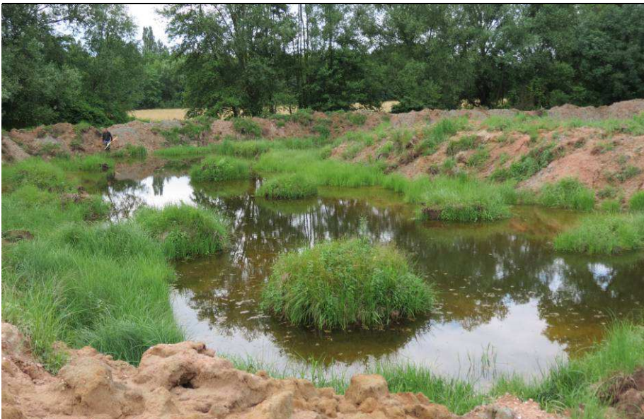
Durch die POLLICHIA-Ortsgruppe im Jahr 2015 umgestaltete Fischzuchtanlage