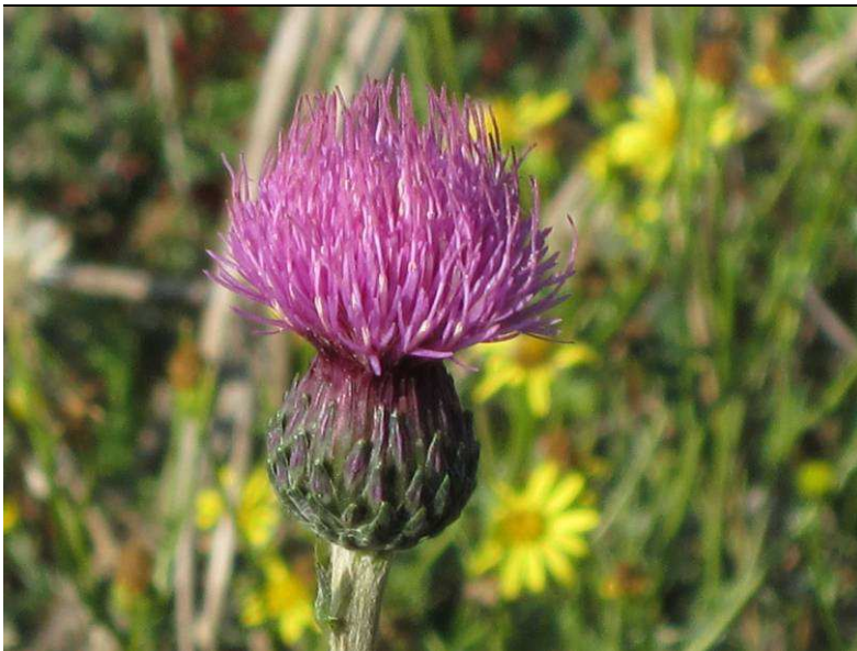
Die in RP gefährdete Knollige Kratzdistel ( Cirsium tuberosum )