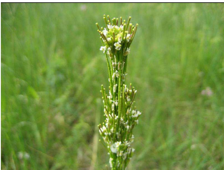
Die in RP stark gefährdete Schmal- blättrige Gänsekresse ( Arabis nemorensis )