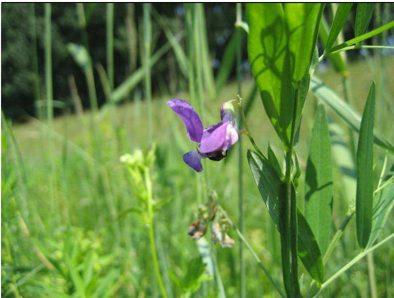
Die in RP stark gefährdete Sumpf- Platterbse ( Lathyrus palustris )