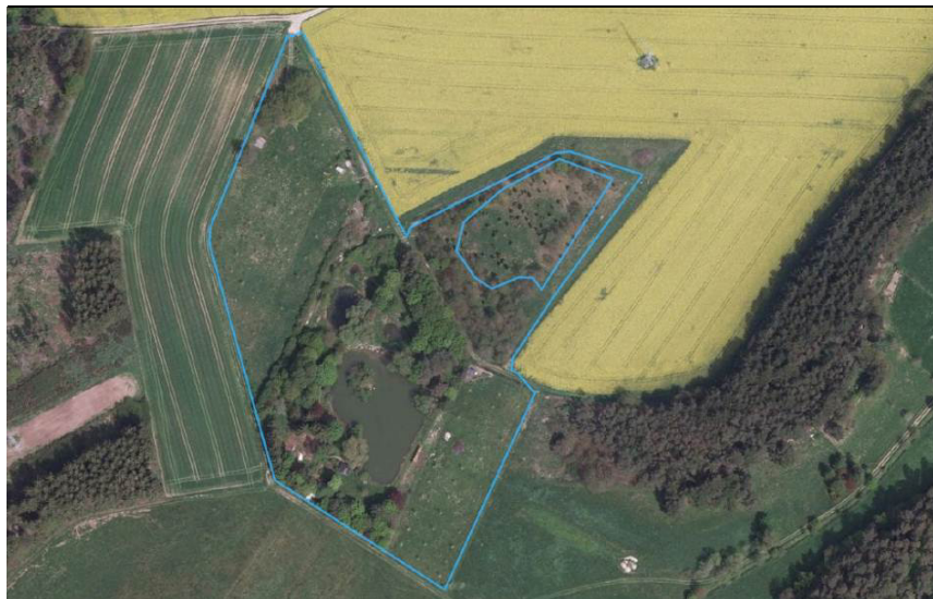
Biotoppflege- Maßnahmenflächen im Gebiet