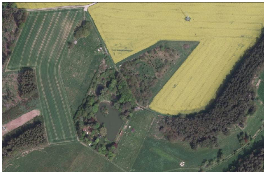
Das Gebiet im Luftbild