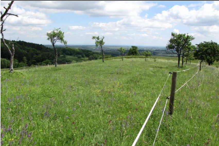
extensive Halbtrockenrasen am Hofgut Eichenlaub