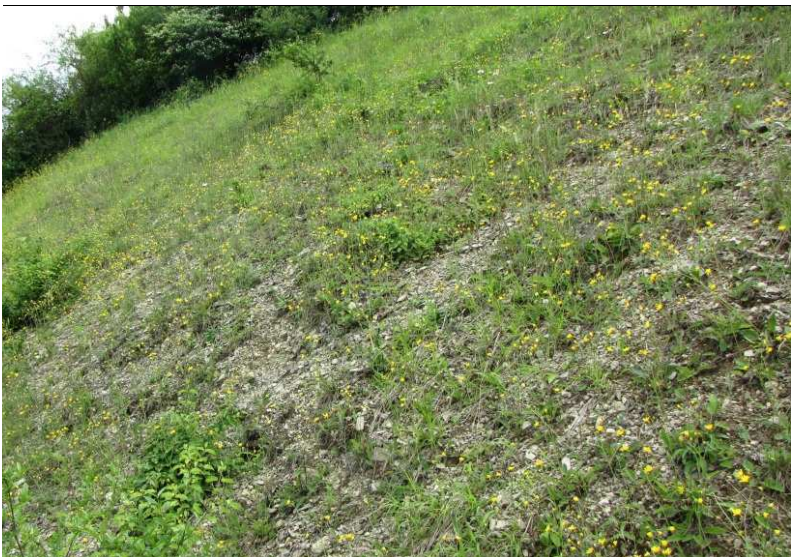
Teilgebiet „Münzäcker“: anstehendes Grundgestein am Steilhang; eine Biotop-Pflege kann nur mit klettersicheren Tieren erfolgen