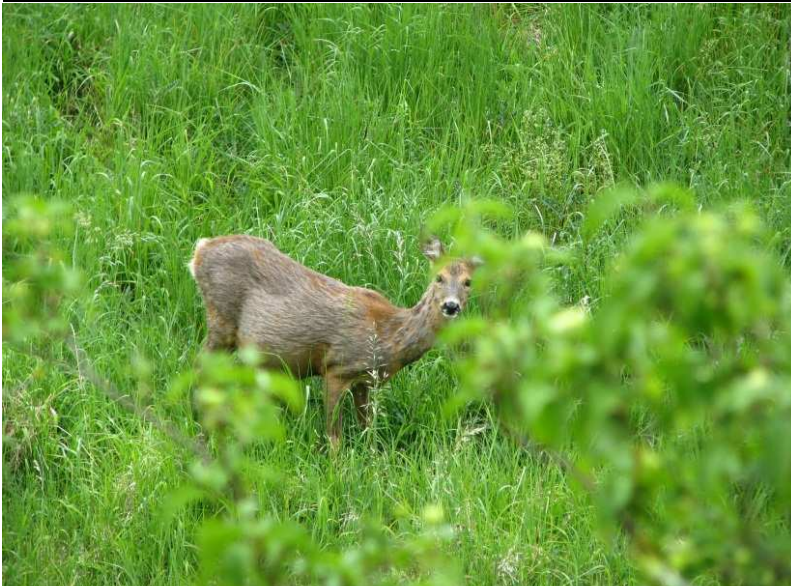
Im NSG „Wolfsteig“ auch da: Rehwild ( Capreolus capreolus )