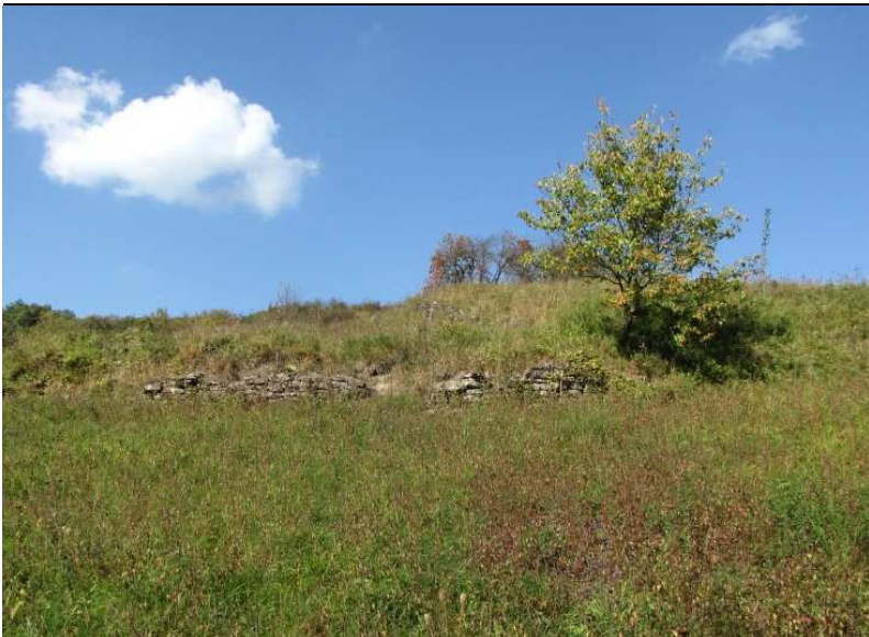
Halbtrockenrasen-Gesellschaften auf kalkhaltigem flachgründigen Boden: ideal für angepasste Pflanzen- und Tierwelt wie Bocksriemenzunge oder Gottesanbeterin