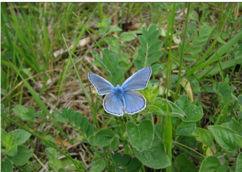
Bläuling im Teilgebiet „Muld“: der flachgründige und wärmebegünstigte Boden bietet Lebensraum für viele seltene Tiere und Pflanzen