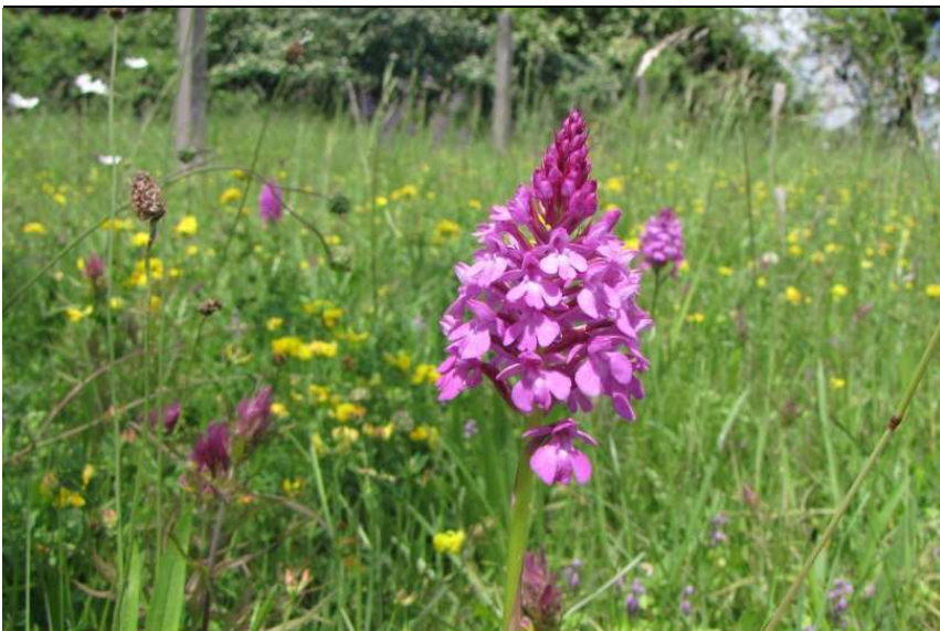
Anacamptis pyramidalis (Pyramiden-Hundswurz) in Gesellschaft mit Bocksriemenzunge und Wachtelweizen