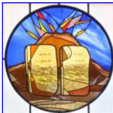
5. Berg Horeb (Sinai) mit den steinernen Tafeln