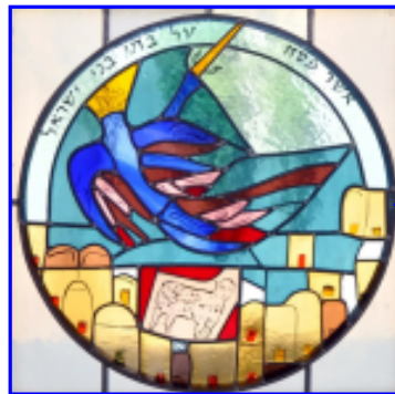
11. Die schützende Hand Gottes