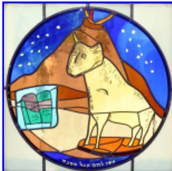
12. Das goldene Kalb am Berg Horeb

Einteilung der Kunstglasfenster auf der Galerie: