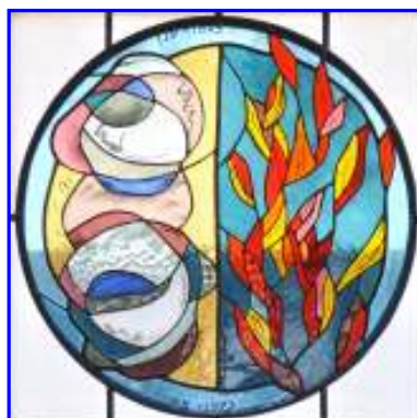
4. Die Wolkensäule und die Feuersäule (Gottes Geleit bei der Wüstenwanderung)