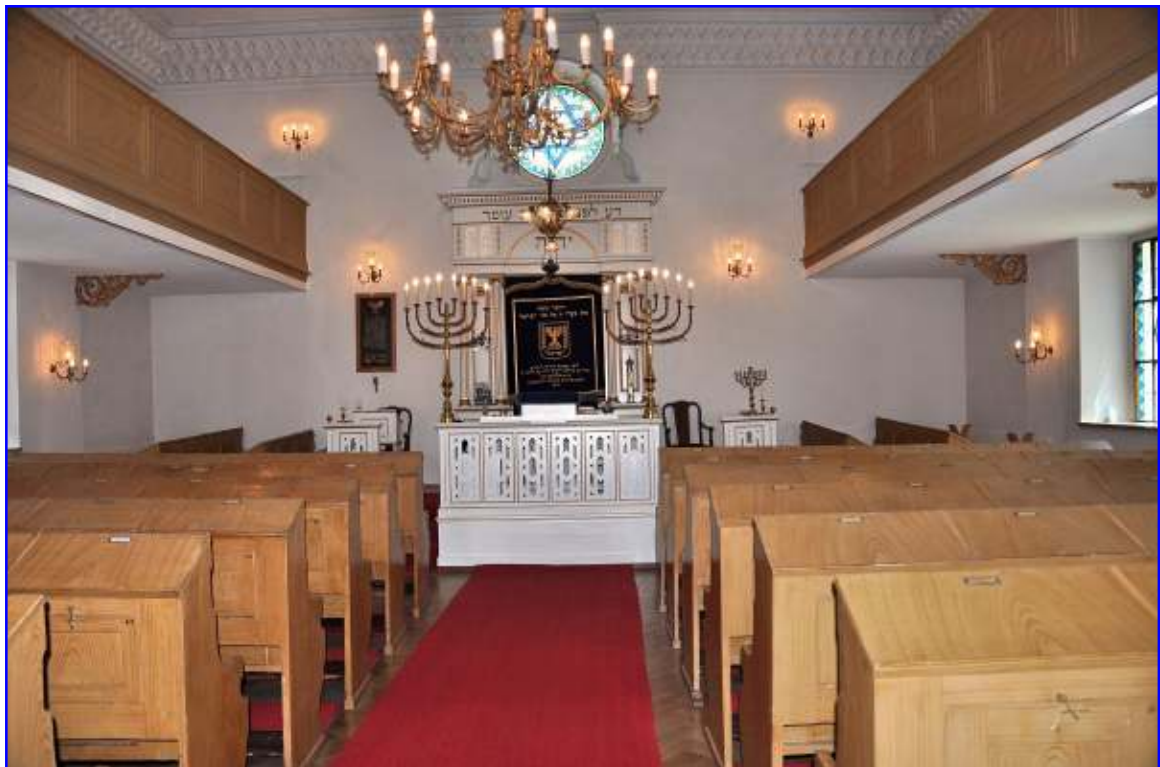
Abb. 8 Im Betsaal - Blick zum Toraschrein