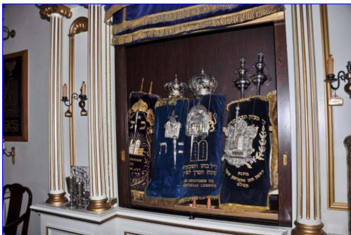
Abb. 10 Blick auf die Torarollen