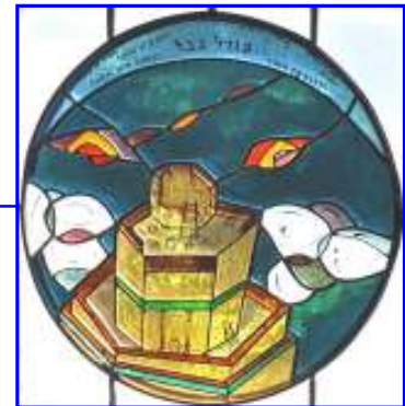
8. Der Turm von Babel