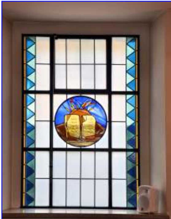
Abb. 11 Berg Horeb (Sinai) mit den steinernen Tafeln (hebräisch: die jeweiligen Anfänge der 10 Gebote), 2. Buch Moses (Exodus 20:1-14)

Die Kunstglasfenster im Parterre haben eine rechteckige Form und diejenigen in der Galerie sind oben abgerundet.