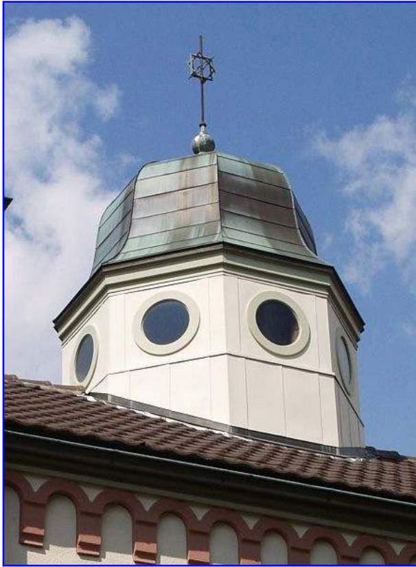
Abb. 5 "Laterne" mit Tambour in der Dachmitte