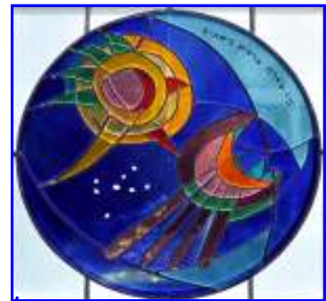
7. Die Erschaffung von Sonne, Mond und Sternen