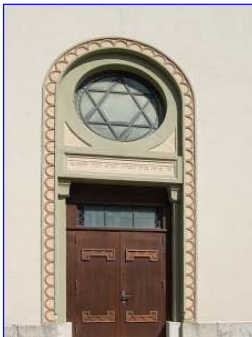
Abb. 3 Das Eingangsportal