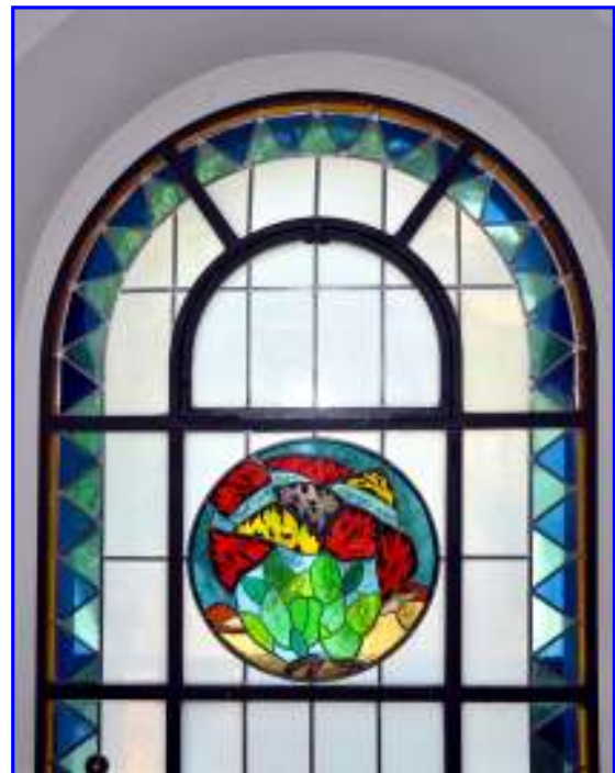
Abb. 12 Der brennende Dornbusch (hebräisch: "Der Dornbusch brannte im Feuer, aber der Dornbusch wurde nicht verzehrt" ). 2. Buch Moses (Exodus 3: 1-8)