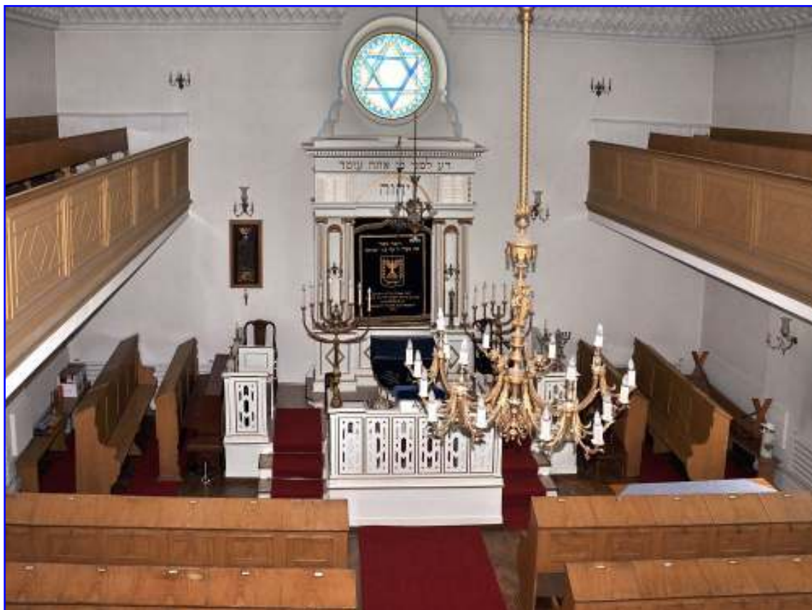
Abb. 9 Blick von der Frauenempore zum Toraschrein