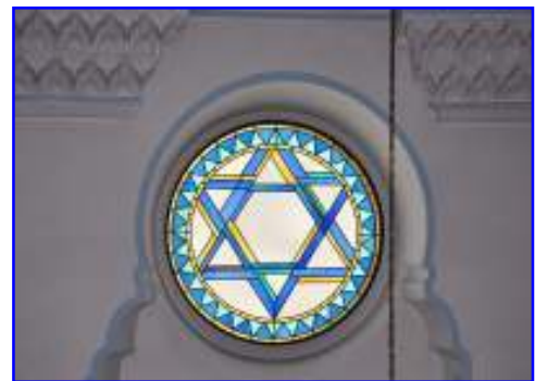
Abb. 7 Rundfenster mit "Davidstern" von innen