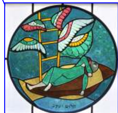
3. Jakobs Traum Darstellung der Himmelsleiter und den auf- und absteigenden Engeln