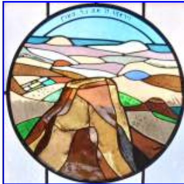
6. Moses darf vom Horb das verheissende Land sehen

Einteilung der Kunstglasfenster im Parterre: