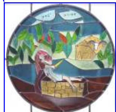
9. Das Opfer von Isaak