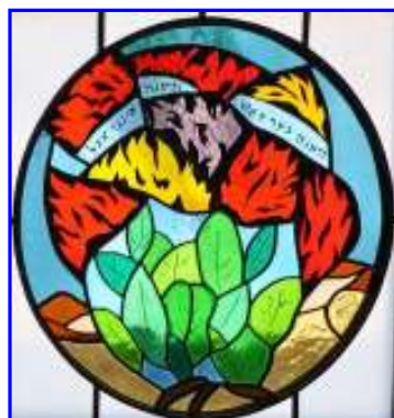
10. Der brennende Dornbusch Zitat aus 2. Buch Moses 3.2: "der Dornbusch brannte im Feuer, aber der Dornbusch wurde nicht verzehrt"