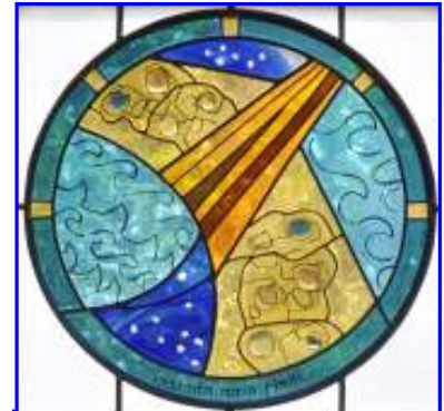
1. Chaos (..die Erde war öd und wüst..)