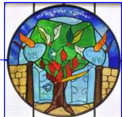
2. Das geschlossene Tor zum Garten Eden