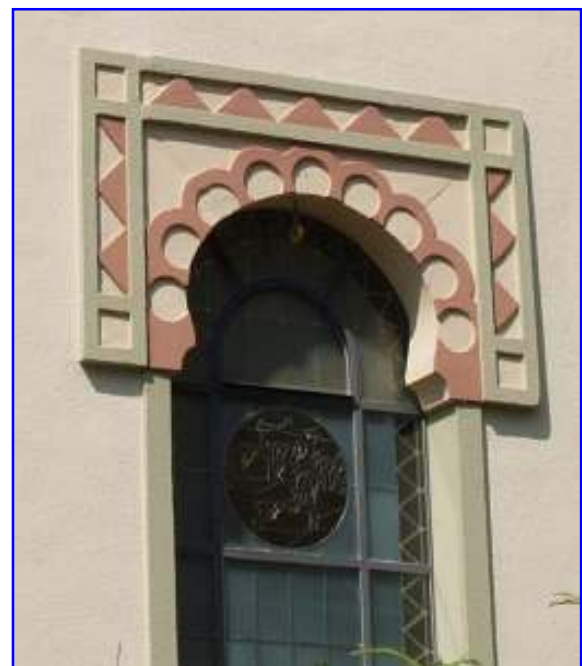
Abb. 4 Blick von Süden auf die mit Hufeisenbögen verzierten Fenster der Längsfassade