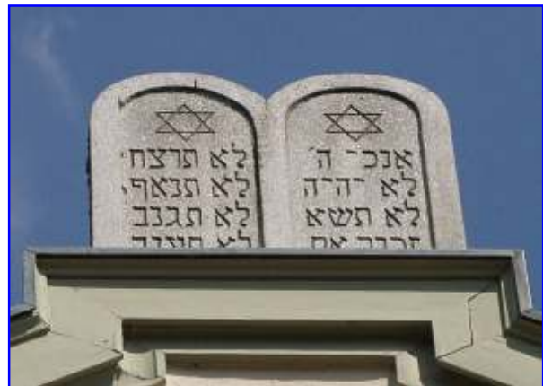
Abb. 1 und 2 Die Gebotstafeln auf dem Giebel der Westfassade