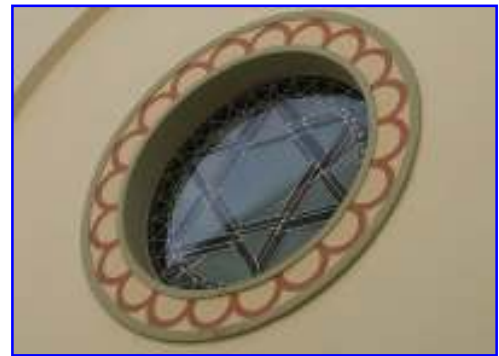
Abb. 6 Rundfenster mit "Davidstern"