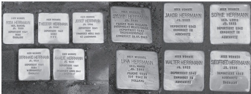
Stolpersteine in Greimerath, Losheim und Oberemmel (v.l.n.r.)