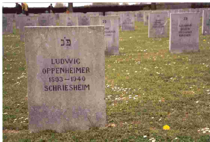
Grabmal für Ludwig Oppenheimer auf dem Friedhof von Gurs

Ludwig Oppenheimer erkrankte im Lager Gurs an Typhus und starb bereits im November 1940.