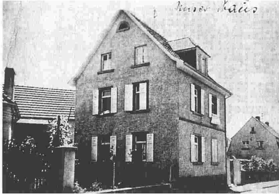
Haus Passein 1 in den 1930er Jahren