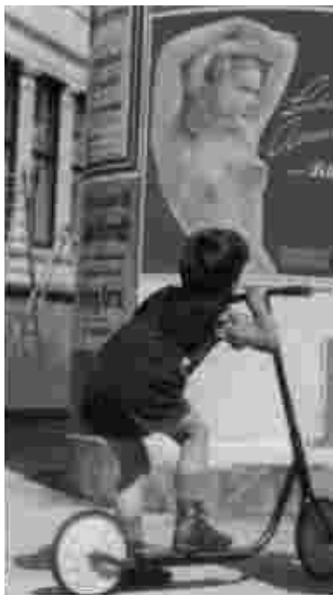
Abb. 8 Felina Werbung 1950

2010: Das 125. Jubiläumsjahr ist wirtschaftlich schwierig. Zwei Drittel des Umsatzes werden im Ausland erzielt. FELINA-International hat weltweit ca. 6.500 Händler sowie 1.000 MitarbeiterInnen - 170 davon in Mannheim.