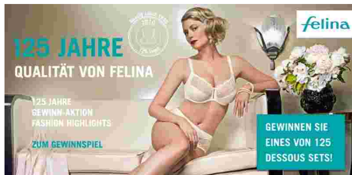
Abb. 9 Felina Werbung 2010