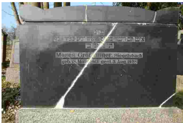
Abb. 11 Grabstein Moses Grötzinger

Und nun ist noch etwas Drittes bemerkenswert: dass nämlich der Grabstein des vierten Grabes im Quadrat, der von Max Holland, mit dem von Moses Grötzinger deckungsgleich ist.