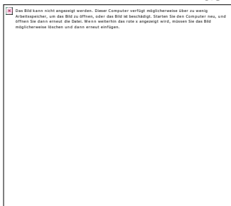
Abb. 3 Wohnhaus Herbst 1885

Das Wohnhaus der Familie Herbst befand sich in der Kirchstraße.