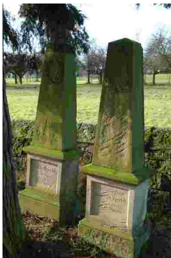
Abb. 6 Grab Salomon und Jette Herbst