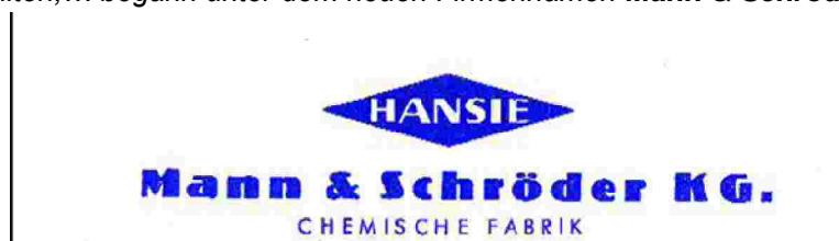
Abb. 13 Firmenlogo Mann & Schröder ca. 1950