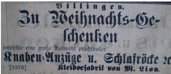
Bild 7a, b: Geschäftsanzeigen im „Schwarzwälder“ von Michael Lion zu christlichen Festtagen (1875).

baden, geboren. Seit dem 18. Jahrhundert wohnten dort jüdische Familien.