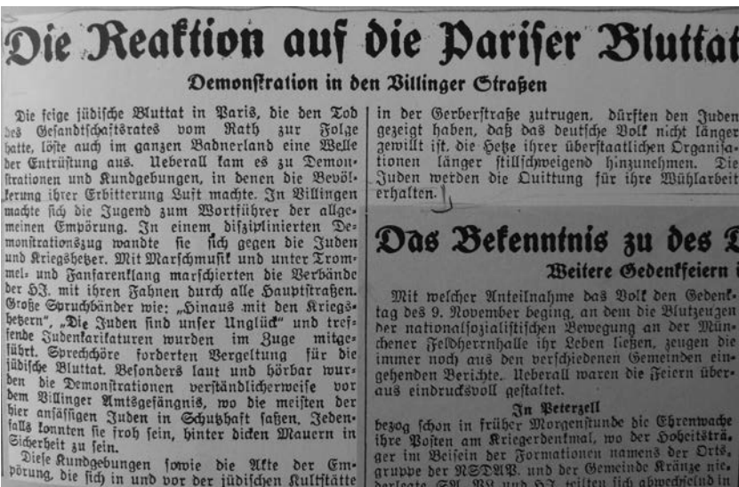
Bild 15: Die „Kristallnacht“ gab es auch in Villingen