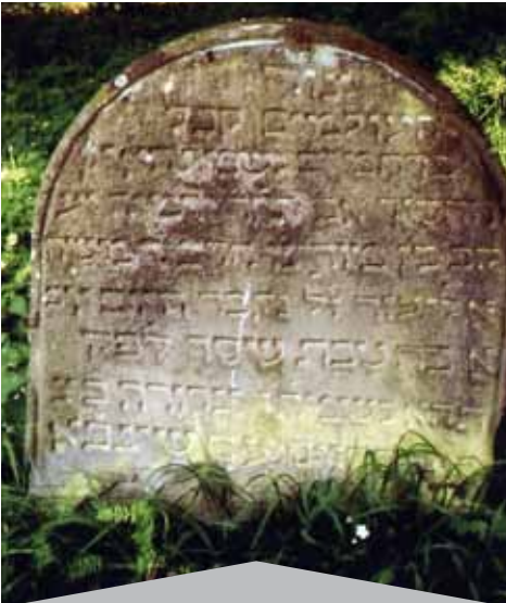
Der Friedhof wurde bereits 1453 angelegt. Der erste Nachweis über einen Toten stammt erst aus dem Jahr 1596, der erste lesbare Grabstein aus dem Jahr 1604.