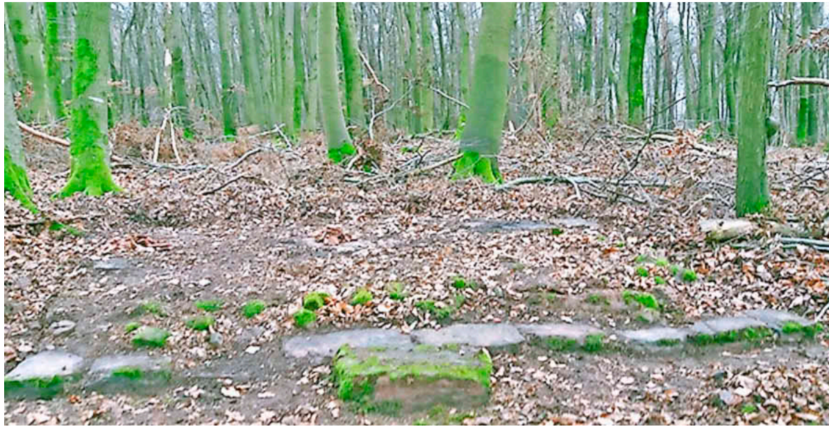
Relikte unterm Laub: Fundamente der Schloßmannhütte fanden sich auf dem Buchenberg.