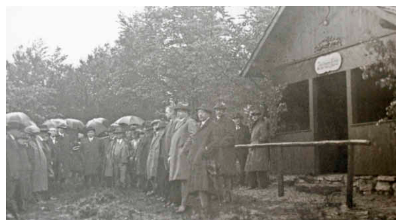
Die Übergabe der Schloßmannhütte am 11. Mai 1930 ist auf diesem Pressefoto im Buch über die Lohrer Ehrenbürger dokumentiert.