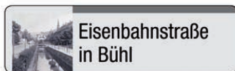
Eisenbahnstraße in Bühl