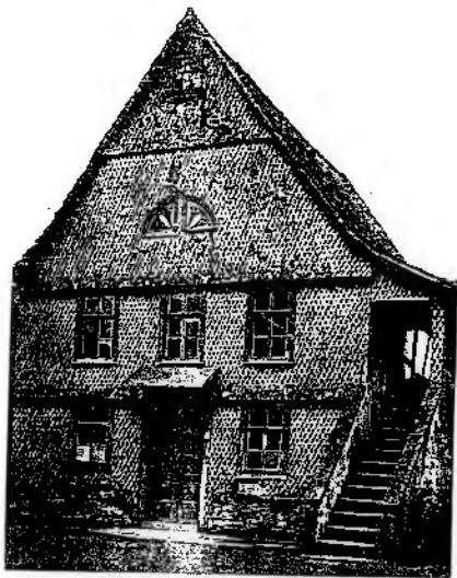
Ehemalige Synagoge Meerholz in der Erbsengasse