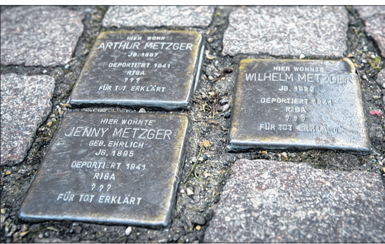
Spuren: 2006 wurden „Stolpersteine“ zur Erinnerung an die Familie Metzger vor deren Haus in der Hauptstraße verlegt.