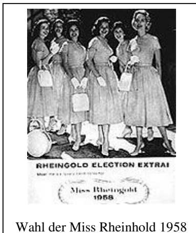
Wahl der Miss Rheinhold 1958

Die alljährlich stattfindende Wahl der „Miss Rheingold“ war begleitet von heute geradezu unverstellbarer Popularität. Bis zu 25 Millionen (!) Wähler beteiligten sich hierbei. Nur zur Wahl des amerikanischen Staatspräsidenten gingen noch mehr Wähler zu den Urnen. Die netten jungen Damen von einst mit ihren adrett dezenten Kleidchen, dem immer strahlenden Gesicht mit vom Lippenstift verwöhnten Lippen mögen heute etwas bieder wirken, und mit Sicherheit waren sie dies auch. Aber sie entsprachen ganz dem Geschmack jener Zeit, liebenswert, häuslich und umgänglich. Eigentlich wünschte sich jede amerikanische Mutter so ein „Girl“ zur Schwiegertochter. Grosse Reichtümer waren mit der „Miss Rheingold“ Wahl allerdings nicht verbunden. Es gab Zuwendungen aller Art in materiell bescheidenem Rahmen, Einladungen zu Festlichkeiten, auch mal ein Jobangebot oder ein Heiratsantrag. Verglichen mit dem Starrummel heutiger Zeit war die ganze Miss Rheingold Aktion eigentlich recht bescheiden, wurde aber vielleicht auch gerade deshalb von den Massen getragen und hat allen Beteiligten Spass gemacht. Spricht man heute ältere New Yorker auf das „Rheingold Beer“ an, so erinnern sich eigentlich Alle recht gern und gut an dieses Bier mit seinem Rummel um die „Miss Rheingold“. Es waren irgendwie doch schon „die guten alten Zeiten“, die 40er, 50er und 60er Jahre.