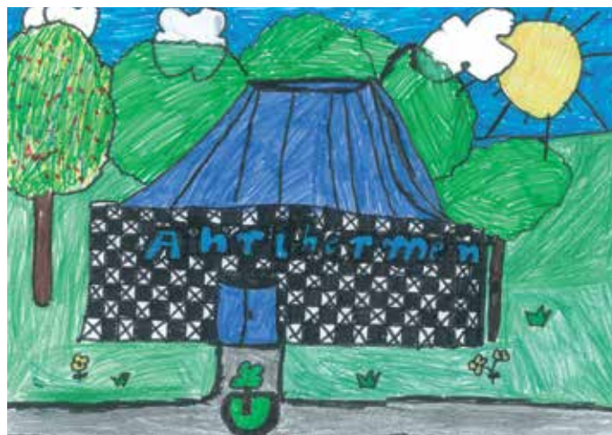
3. Platz: Ahmed, 4. Klasse

Weitere Bilder können Sie auf der Internetseite www.gruencard.de bewundern. Die GrünCard, vertreten von Patrick Küpper, bedankt sich bei allen Kindern die mitgemacht haben. Alle Bilder waren fantastisch. Weitere Bilder und Infos über die GrünCard finden Sie unter www.gruencard.de .