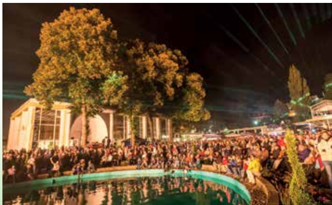
Während der Klangwelle wird der Kurpark zum Event-Gelände.

Heilbad Gesellschaft bietet Angebote rund um Gesundheit und Erholung. Der Kurpark Bad Neuenahr mit der Heilwasser-Quelle „Großer Sprudel“ bildet das Herzstück der weitläufigen Parkanlagen in Bad Neuenahr-Ahrweiler. Seit zwei Jahren ist die neu gegründete Heilbad Gesellschaft Bad Neuenahr-Ahrweiler für die Pflege und den Erhalt von Park und Liegenschaften, den Quellbetrieb, zahlreiche Angebote aus dem Gesundheitsbereich sowie ein umfangreiches Kulturprogramm verantwortlich. Auch 2016 bietet die Heilbad Gesellschaft erneut eine Fülle an attraktiven Veranstaltungen an. Angefangen beim Highlight, der Wasser-, Laser- und Lichtshow „Klangwelle“, über Unterhaltung mit bekannten Stars wie René Kollo, Thorsten Havener oder Margie Kinsky bis hin zu Parkfesten, Events und Familienveranstaltungen ist für jeden Kultur-Geschmack das Richtige dabei. Darüber hinaus wird die beliebte Reihe „Konzerte im Park“, welche sowohl klassische Konzerte in verschiedenen Ensembles sowie regionale Musikvereine, Chöre und Musiker präsentiert, weitergeführt. Informationen unter www.das-heilbad.de oder bei Facebook.