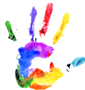
1. Platz: Rodi, 4. Klasse