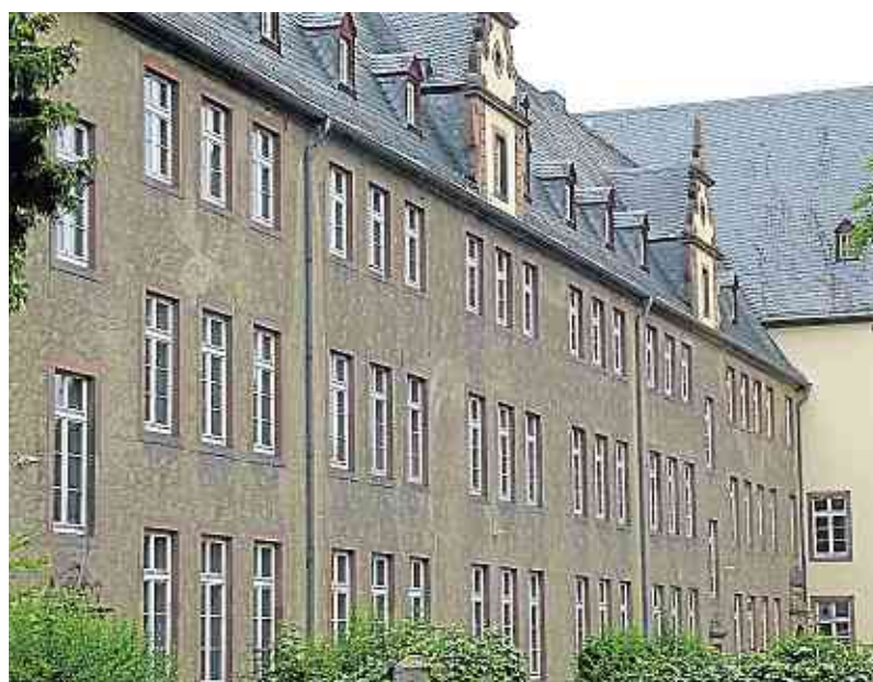
1903 erhielt Koblenz ein Lehrerinnenseminar, für das von 1907 bis 1909 auf dem Oberwerth ein eigenes Gebäude errichtet wurde.