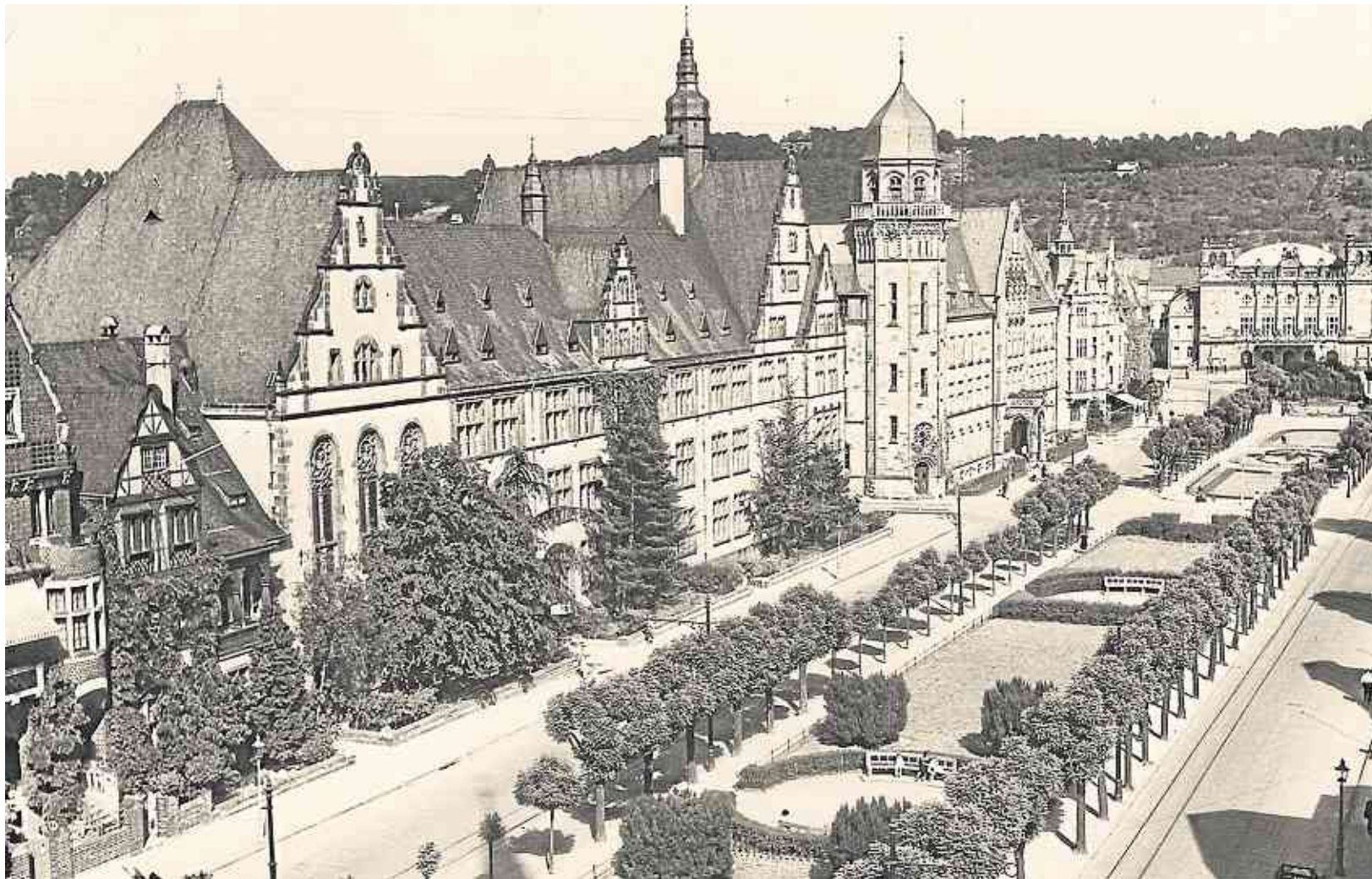
Der Neubau für das Kaiser-Wilhelm-Realgymnasium wurde 1907 vollendet. Das Gebäude am Friedrich-Ebert-Ring wurde 1944 bis auf die Umfassungswände zerstört und anschließend vereinfacht aufgebaut und überformt. Es ist heute Heimat des Eichendorff-Gymnasiums.