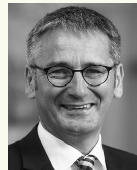
Hendrik Hering Präsident des Landtags Rheinland-Pfalz