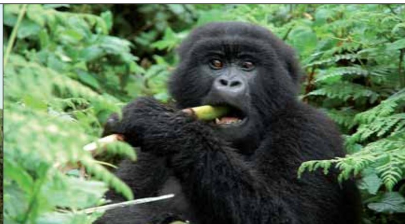
Heimat der seltenen Berggorillas.