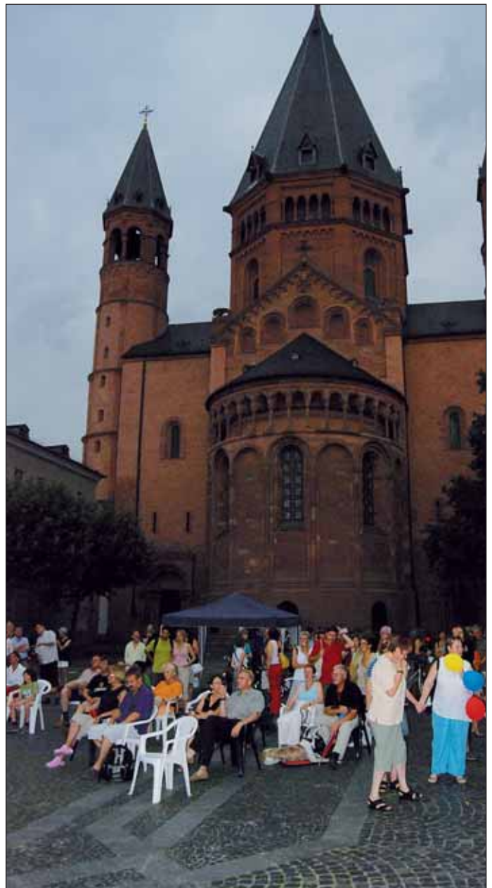
... war der 2. Aktionstag zu den UN-Millenniumzielen - trotz der gegen Abend drohenden Gewitterwolken - rundum gelungen.