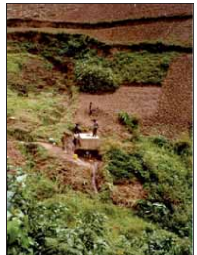
Wasserprojekt in Ruanda.

In einem der Slums der Kleinstadt Ruhengeri, die im Norden Ruandas im Distrikt Musanze liegt, wurde aus Mitteln des Wasserfonds Ruanda erstmals eine Versorgung mit Trinkwasser sichergestellt. Bisher versorgte sich dort die Bevölkerung mit Wasser aus dem nahegelegenen Fluss, in den auch die Abwässer der Stadt eingeleitet wurden. Jedes Jahr war daher in der Trockenzeit der Ausbruch von Seuchen zu beklagen. Der dortige Wasserversorger war bisher nicht in der Lage, diesen Vorort an die Wasserversorgung anzuschließen. Auf Antrag aus dem Koordinationsbüro in Kigali bewilligte der Wasserfonds Ruanda rund 7.700 Euro für den Bau und Betrieb einer einfachen gravitären Wasserversorgung. Dazu wurde zunächst eine vorhandene Quelfassung rehabilitiert und durch eine zusätzliche Brunnenstube ergänzt, um die festen Inhaltsstoffe sedimentieren zu lassen. Von dort wurde eine rund 360 Meter lange Versorgungsleitung (PVC) zu einem Wasserreservoir mit einem Volumen