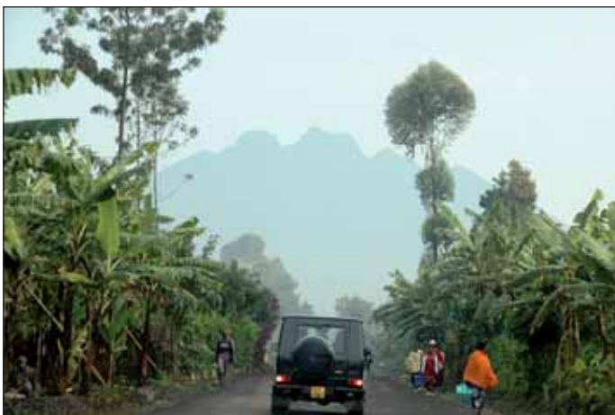
Der Vulkanpark im Norden.

Verantwortlich für die Förderung und Vermarktung des Tourismus und die Bewah- ▶