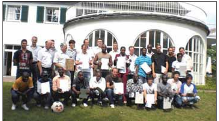
Glückliche Teilnehmer des internationalen Trainerlehrgangs in Koblenz.