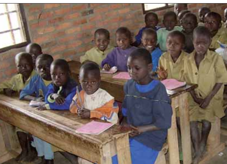
Kinder der Grundschule Cyima im neuen Klassenzimmer.