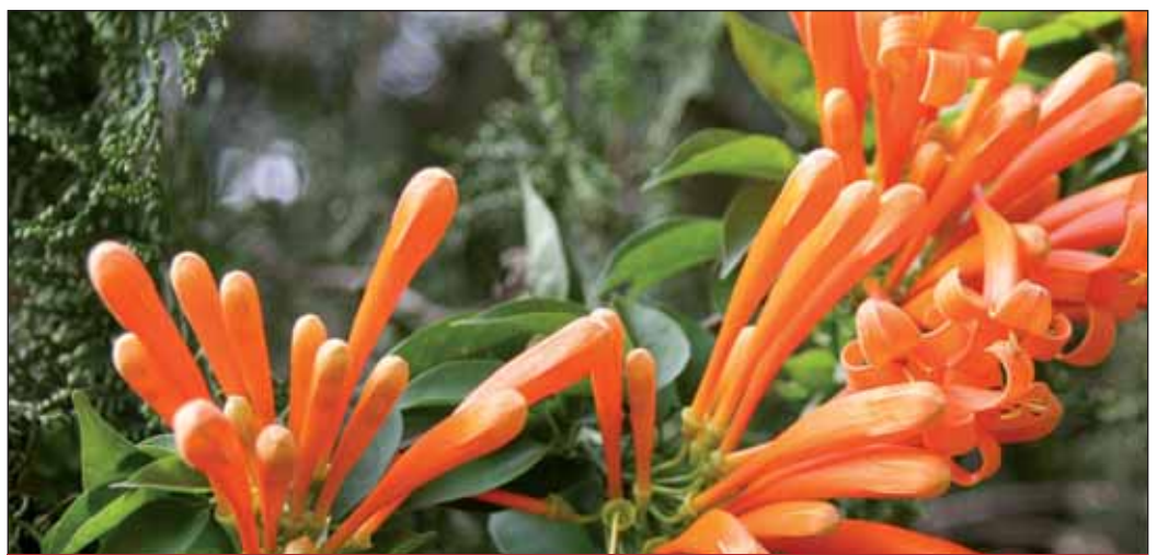
Ruanda – ein schönes Land.

Der Tourismus war im letzten Jahr der Wirtschaftszweig mit dem höchsten Wachstum in Ruanda. Mit 42,3 Millionen US-Dollar Einnahmen übertraf er zum ersten Mal die Kaffee- und Teeindustrie. Dies ist unter anderem Ergebnis einer langfristigen Strategie der ruandischen Regierung, die den Tourismus neben den o.g. Wirtschaftszweigen zur Schlüsselindustrie Ruandas erklärt hat. Der Ausbau dieser Branche wird auch im Anstieg der Touristenzahl, der zur Verfügung stehenden Hotelbetten und Restaurants deutlich. Im Jahr 2007 besuchten 39.000 Touristen Ruanda, ein Anstieg von über 25 Prozent im Vergleich