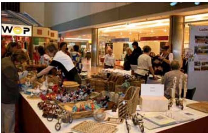
Der Ruanda-Stand des Förderkreises Rwankuba aus Ludwigshafen-Maudach.

Fast 300 Zuhörerinnen und Zuhörer lauschten den Beiträgen der Grundschule „Domholzschole“ Limburgerhof.