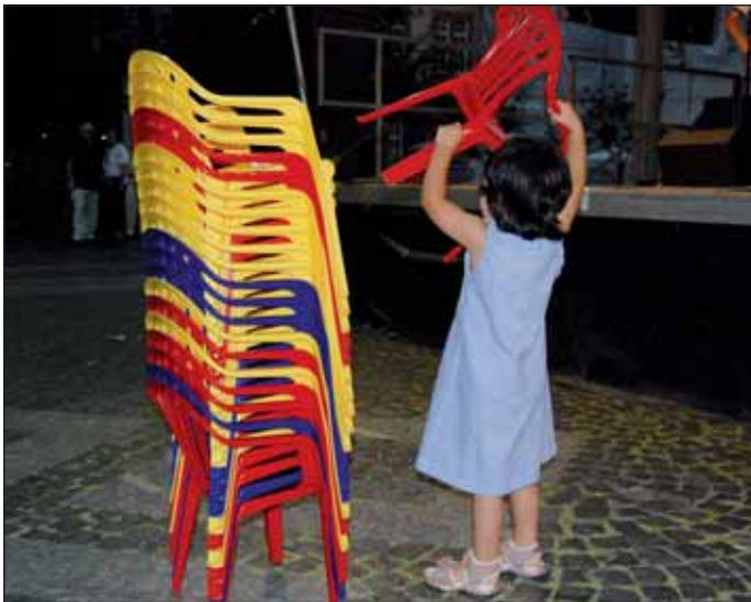
... und räumten hinterher mit auf.