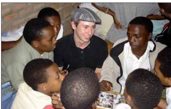
Ruandische und deutsche Schüler im Gespräch.

Während im Südschwarzwald noch nasskalter Winter herrschte entflohen sieben Schüler und Schülerinnen, vier Lehrer der Justus-von-Liebig-Schule Waldshut und die Leiterin des Kindergartens Weilheim-Nögenschwil der heimischen Witterung und machten sich auf ins warme Afrika. Sie folgten damit einer Einladung der Partnerschule, des Collège Immaculée Conception C.I.C. in Save im Süden von Ruanda. Schwester Raphael-Marie vom Orden der Benebikira-Schwestern sagte schon 1986, als die ersten Kontakte geknüpft wurden: „Wollt ihr eine Partnerschaft aufbauen, solltet ihr wissen, wovon ihr redet. Ihr müsst unbedingt nach Ruanda kommen.“ Diesem Rat waren schon