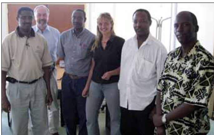
Verhandlungspause im Ministerium in Ruanda.