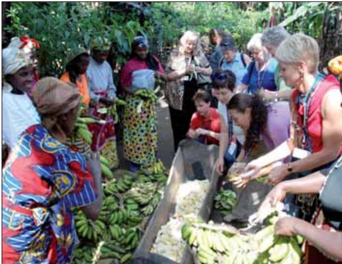
Besuchergruppe hilft bei den Bananenbierbrauen.

Kultur, zum Umweltschutz und zur Aussöhnung und ein grundlegender Mentalitätswandel gehören dazu. All dies klingt jetzt so, als wären wir eine Nichtregierungsorganisation oder ein Verein, der in der Entwicklungszusammenarbeit tätig ist. Aber weit gefehlt.