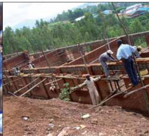
Besuch des Kinderdorfs „Mission de la croix glorieuse“ in Kigali.