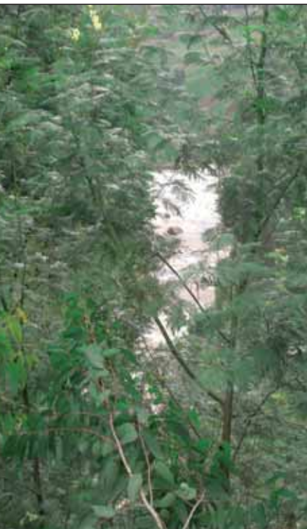
Ruanda ist ein grünes Land.

Die Entwicklung der Nationalparks ist in erster Linie die ORTPN. Sie setzt dabei vor allem auf die landschaftlichen Schönheiten, aber auch auf die Kultur des Landes. Sie wirbt mit Touren zu den letzten Berggorillas und hat sich vorgenommen, wieder zum führenden Gorilla Ziel in Afrika zu werden. Die Gorillas sollen in die Liste des UNESCO Weltkulturerbes aufgenommen werden.