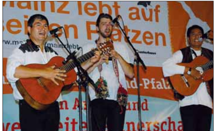
... bis zum abschließenden Konzert mit Eco Latino ...