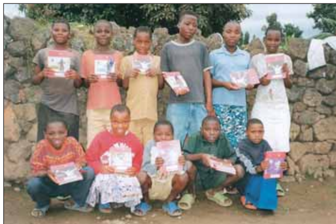
Kinder der Gruppe AENA (Kinder ohne Eltern) erhielten Schulmaterial.

Klassenzimmer mit Schulmöbeln und einer Zisterne in Rwanzuki im Bau. Das Partnerschaftsbüro in Kigali unterstützt und koordiniert die Projekte. Einige andere Schulen in Ruanda (Nyundo, Kigogo, APEFOC) erhielten Schulmaterial. In Nzuki werden Patenkinder unterstützt. Bedürftige Kinder in Kanama und anderen Gemeinden erhielten Kleidung, Nahrung und Schulmaterial. Die Vereinigung der Behinderten TUZAMURANE wird mit Rollstühlen, Gehhilfen und anderen Hilfsgütern versorgt. So gingen Mitte 2008 allein 14 Pakete mit Hilfsgütern auf die Reise ins Partnerland. Gemeinsam mit dem Kurfürst Ruprecht Gymnasi-