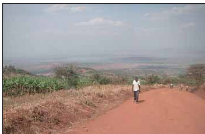
Eine Herausforderung für die neue Partnerschaft: Das Land südlich des Akagera-Parks ist arm, trocken und nicht sehr fruchtbar.

„Es gibt viel zu tun!“, betonte er im Hinblick auf die von Co-