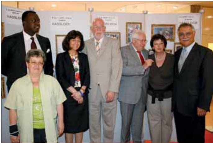
Am Stand des Förderkreises Ruanda aus Haßloch.