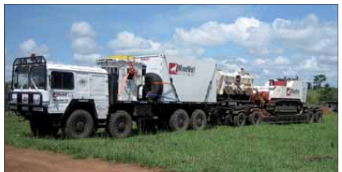
MineWolf-Konvoi Sudan/Uganda/Ruanda.

Ruanda wurde mit Minen kontaminiert im Bürgerkrieg von 1990 bis 1994 und während des Genozids 1994. Strategisch wichtige Punkte, wie die Außenbezirke von Kigali, aber auch Tee- und Kaffee Fabriken, versuchte man durch einen Minengürtel zu schützen. Ich entdeckte im Internet einen Hilferuf des ruandischen Minenex-