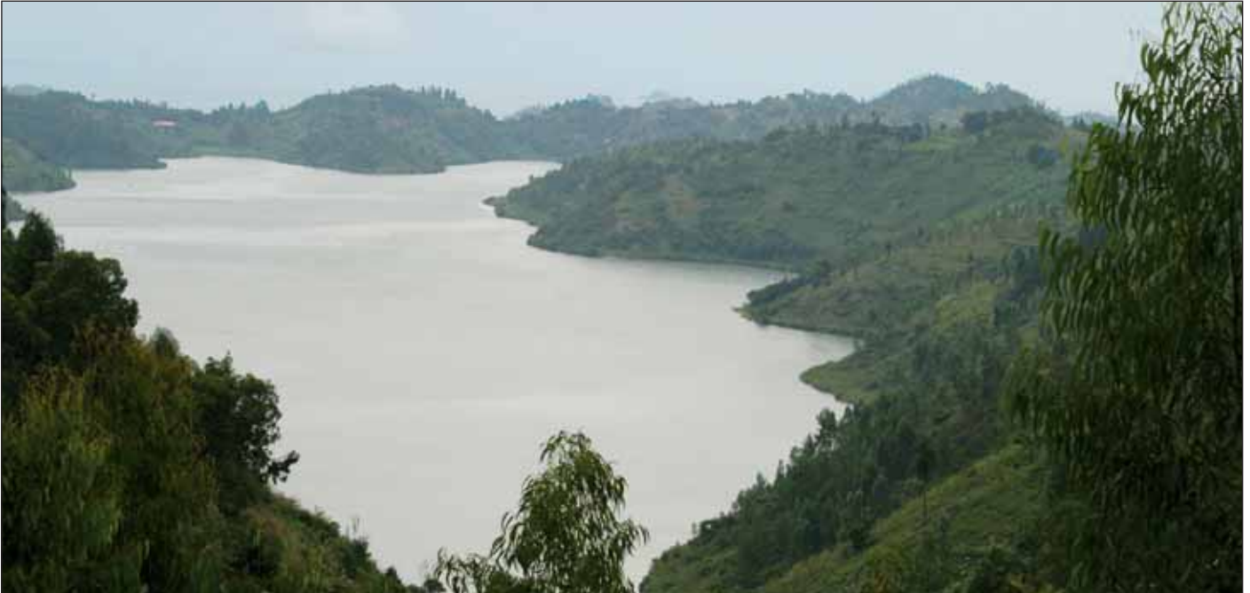
Idyllischer Blick auf den Kivusee.

beratende Unterstützung durch die Compass GmbH, eine deutsche Beratungsgesellschaft an der Cologne Business School. Ferner ist die Compass GmbH damit betraut, ein deutsches Marketingbüro für Ruanda aufzubauen. Bis jetzt existiert noch kein Ausbildungsgang im Hotel- und Re-