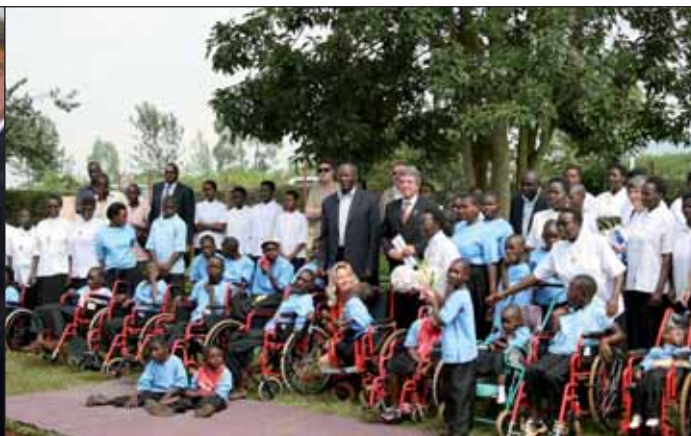
Die Delegation mit Kindern und Betreuerinnen des Behindertenzentrums Gahanga.