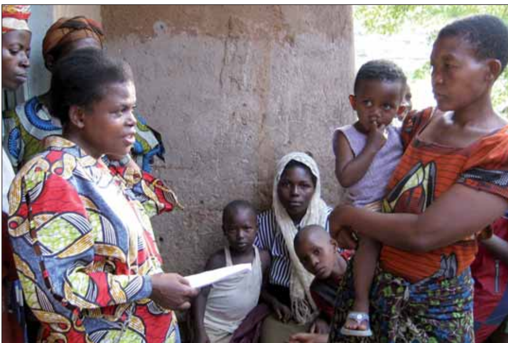
Um sich für eine Verbesserung ihrer Lebenssituation einzusetzen, erzählen neun HIV – infizierte ruandische Frauen ihre Lebensgeschichte.