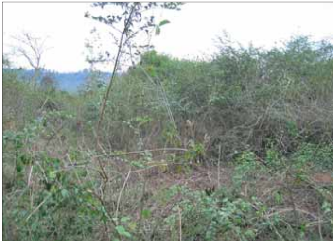
Mit Minen kontaminierte Fläche.

führen wir, dass der Einsatz eines ferngesteuerten Roboters – ein Mini-Bagger – beim Versuch, die Minenfläche zu räumen, aus technischen Gründen gescheitert war.