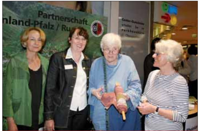
Am Stand der Partnerschaft Rheinland-Pfalz/Ruanda