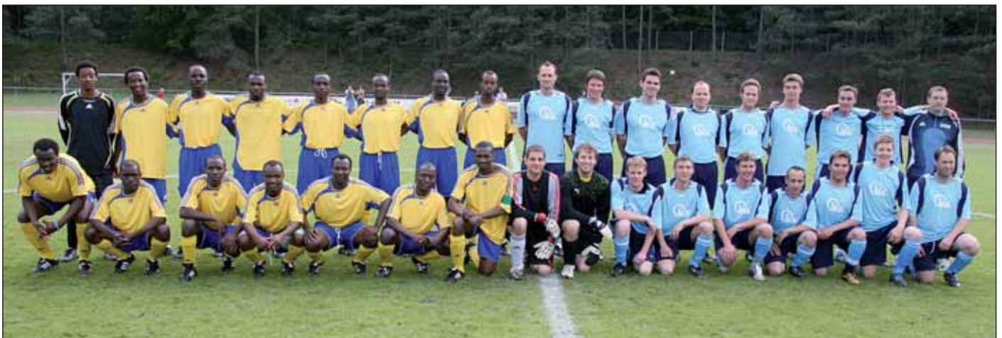
Gemeinsames Mannschaftsfoto von FC Ruanda KL und TUS Erfenbach. Erfenbach gewinnt 6:1.

Text und Foto: Matthias Schwarz, Pfarrei Kaiserlautern-Erfenbach