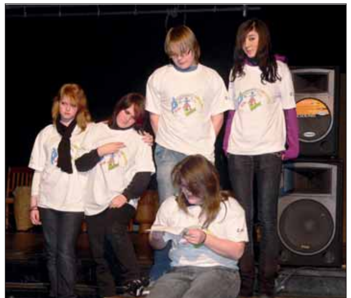
Aids geht uns alle an – Schüler der Frida-Levy-Gesamtschule bei einem Theaterstück über Ruanda.

Ziel des Projektes ist es auch, eine Brücke nach Deutschland zu schlagen. Auch hierzulande steigen die HIV-Infektionszahlen wieder an und die Unkenntnis über HIV/AIDS unter Jugendlichen ist erschreckend. Mitarbeiter der Aids-Hilfe Essen, von Exile Kulturkoordination sowie action medeor be-