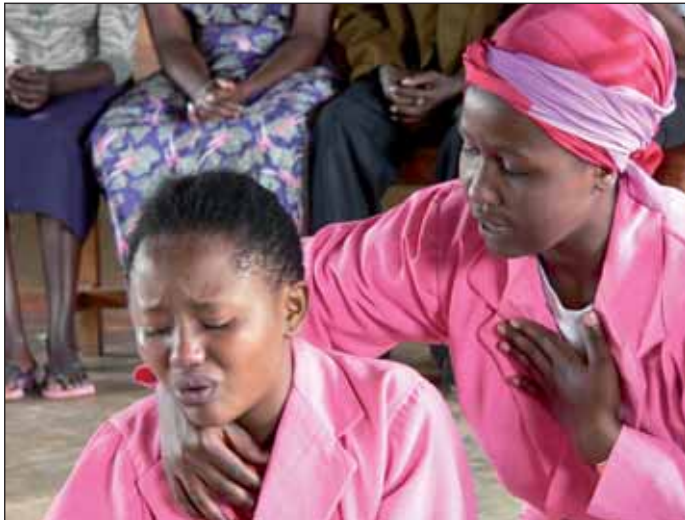
Solidarität im Kampf gegen HIV/AIDS – Theaterszene einer Aufführung der Karenga Secondary School.