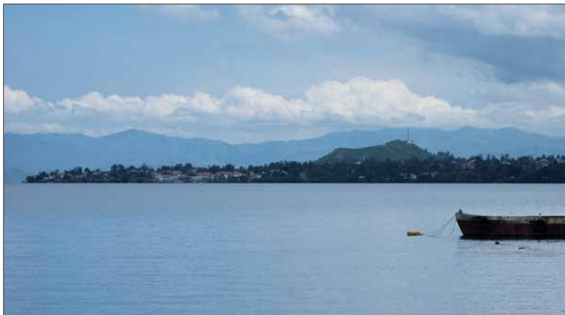
Schön aber trügerisch: Der Kivu See in Ruanda.

Der Vorstand der W+S Beteiligungs AG, der im Mai 2006 zum ersten Mal vor Ort war, wiegelt vorsichtig ab: „Sehr geehrte Aktionäre, betrachten Sie das Projekt Kivu See zur Zeit bitte buchstäblich als Luftblase! Wir sind zuversichtlich, in den nächsten Monaten eine technisch sichere und wirtschaftliche Lösung zur Gewinnung des Methans aus dem See mit den entsprechenden Fachleuten zu erarbeiten und werden das Ergebnis mit der Regierung von Ruanda verhandeln. Aber erst mit der Vertragsunterzeichnung, Sicherstellung der Finanzierung und der anschließenden Realisierung wird aus der Luftblase ein greifbares Projekt!“ Die Vorsicht des Vorstandes war nicht