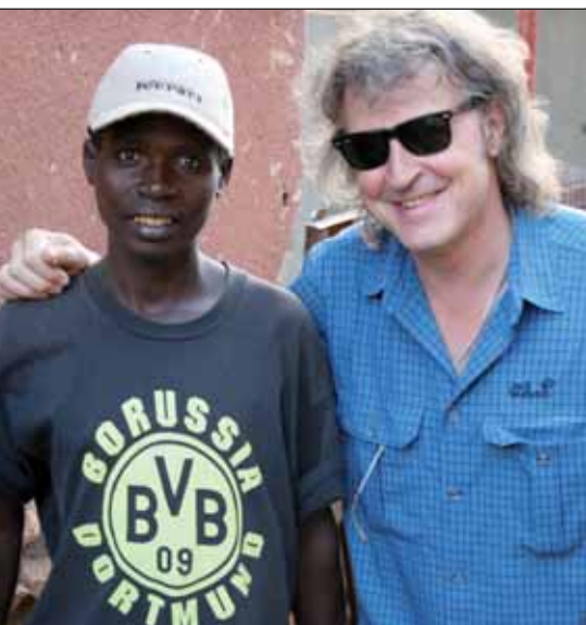
Wolfgang Niedecken im Straßenkinderprojekt.