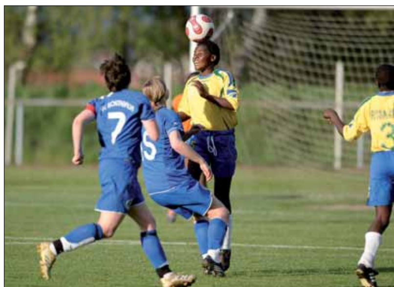
Fairer Einsatz im Spiel der ruandischen Frauennationalmannschaft gegen den FFC Montabaur in Altdiez.