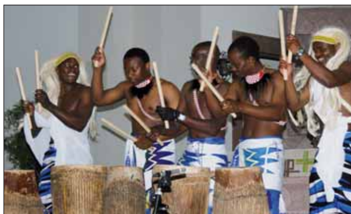
Ruandische Trommler im ökumenischen Gottesdienst.