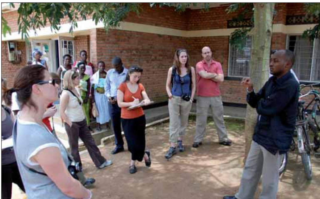
Arzt erklärt einer Besuchergruppe die Gesundheitsinterventionen.

Ein exzellentes Beispiel für die Erfolge des MVP ist das Gesundheitswesen in Mayange. Ende 2005 hatten die Bewohner ihr Vertrauen in das Gesundheitszentrum verloren. Zusätzlich zu den bereits erwähnten Problemen (kein Wasser, kein Strom, kein Arzt) gab es horrenden Preisstrukturen, große Entfernungen und keinen verfügbaren Transport. 94