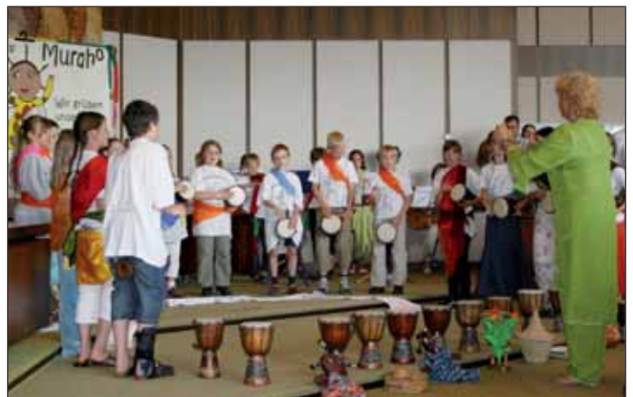
Die Grundschule „Domholzschole“ Limburgerhof beim Festakt.