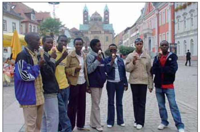
Die ruandesische Gruppe mit dem ersten Eis in der Maximilianstraße in Speyer.