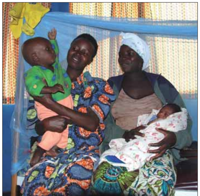
Werdende Mütter kommen jetzt gerne ins Besucherzentrum.

ziele erreicht haben, und dann soll sich das MVP wieder zurückziehen. Bis dahin ist noch ein weiter Weg. Das wichtigste Ziel ist und bleibt jedoch, die Einheimischen zu ermächtigen, die neuen Strategien selbst weiterzuführen und sich dadurch selbst aus der Armutsfalle zu befreien. ■