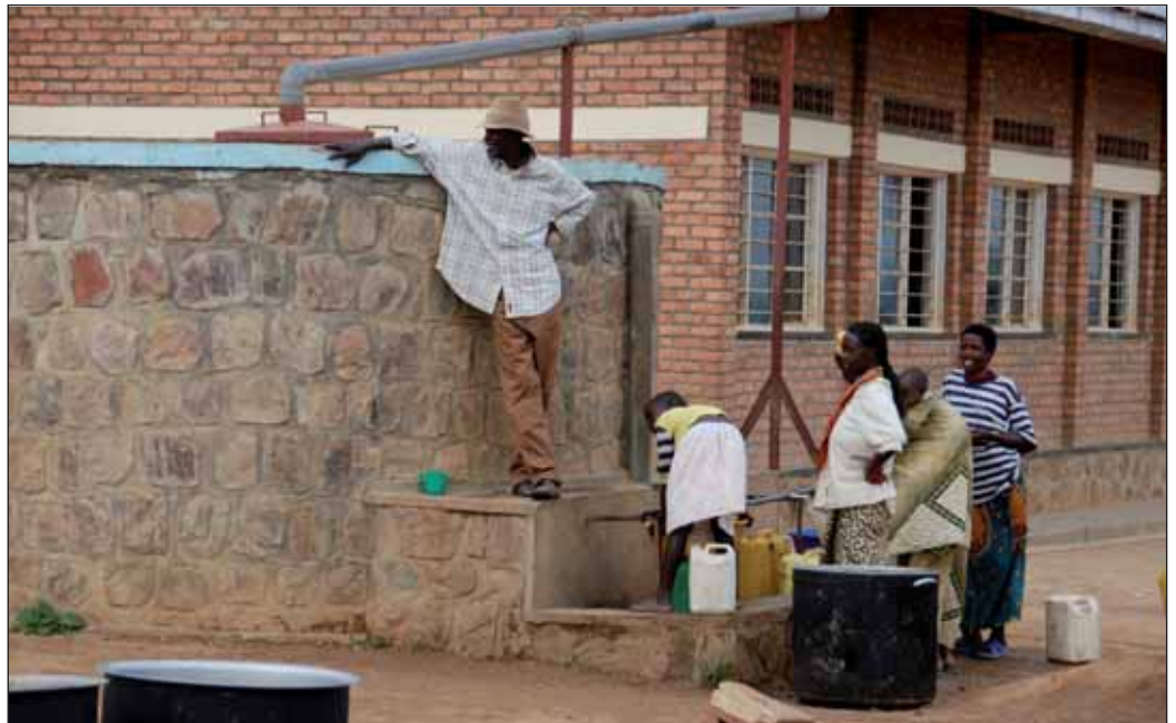
Wassertank an einer Grundschule.

Seit März 2006 arbeitet das MVP nun daran, die Leistungen des Zentrums zu verbessern und auszuweiten, finanzielle Hindernisse zu beseitigen, eine Basisversorgung auch dezentral durch Satellitengesundheitsposten zu gewährleisten und Gemeindesozialarbeiter und Krankenschwestern für individuelle Versorgung und Vorsorge von Haus zu Haus zu schicken. Ruandas erster von der Regierung eingesetzter Doktor in einem ländlichen Krankenhaus und inzwischen über 20 Krankenschwestern arbeiten nun Tag und Nacht, Strom und Wasser sind vorhanden, zumindest die notwendigen Medikamente sind ausreichend und die Angestellten haben umfangreiche Weiterbildung auch in Management und administrativen Angelegenheiten erhalten. 94 Prozent der Bevölkerung erhalten finanzielle Unterstützung für ihre Mitgliedschaft in einer Krankenversicherung und vier Außenposten sowie ein Krankenwagen garantieren verbesserten Zugang zu den Dienstleistungen. Als Resultat kommen inzwischen über 5.000 Patienten pro Monat ins Gesundheitszentrum und freuen sich über wirkliche Hilfe, die sie sich auch leisten können.