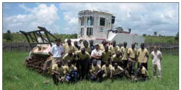
MineWolf-Maschine mit Sudan-Minenräum-Team.