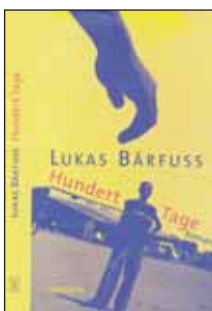
Lukas Bärfuss: Hundert Tage, Wallstein Verlag, Göttingen 2008