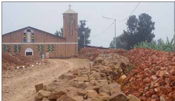
Shangji: Spuren der Zerstörung

In Shangji steht praktisch kein Stein mehr auf dem anderen. Die Grundschule, das Schwesternkonvent, der Gemeindesaal und etliche Privathaushalte