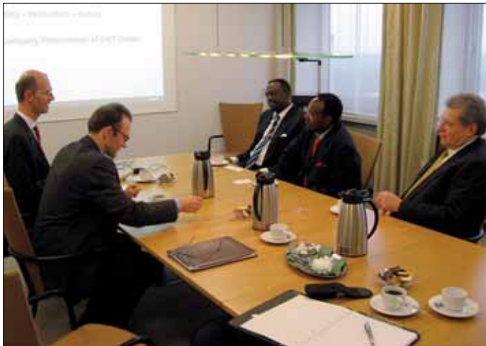
Vorstellung der Projektplanung für den ruandischen Botschafter Eugène Gasana und den ruandischen Minister Albert Butare.