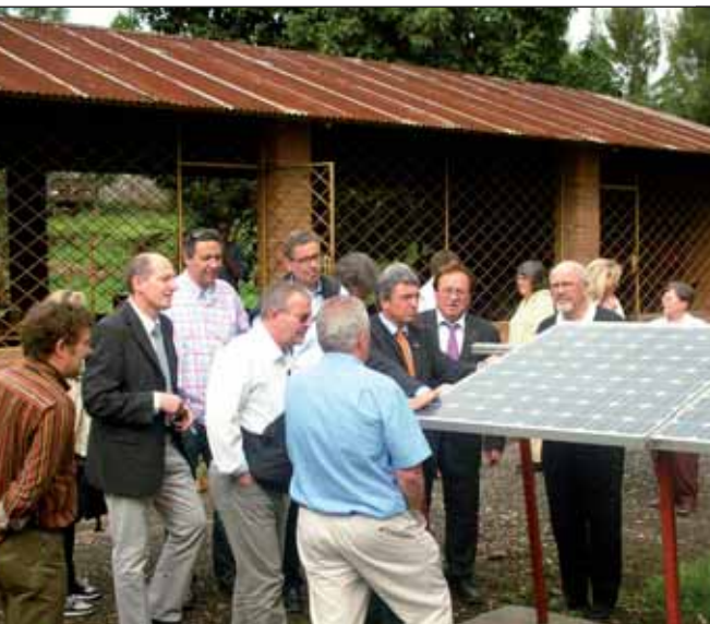
Projekt der Handwerkskammer Rheinessen in Gisenyi.