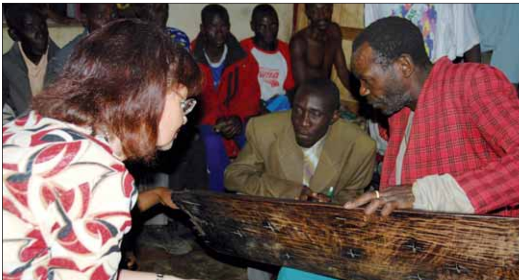
Batwa Musiker erklärt Besucherin das Spielen der Inanga.

nen. Denn nur wenn wir selbst davon profitieren können, wird auch unser Projektpartner davon profitieren. Wir schaffen also „win-win“ Umfelder und investieren kräftig in ländliche Entwicklung und Armutsbekämpfung.