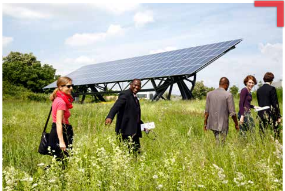
Teilnehmende der kommunalen Klimapartnerschaften bei der Posterpräsentation während des Internationalen Workshops zur Präsentation der Handlungsprogramme in Würzburg 2013

Akteure – Verwaltung, Politik, Zivilgesellschaft, Wissenschaft und Wirtschaft – können Veränderungen hin zu einer nachhaltigen Entwicklung in den Kommunen erreicht werden. Die folgenden beiden Beiträge der deutsch-ruandischen Klimapartnerschaften der sechsten Phase geben einen guten Einblick zu möglicher Motivation und Zielen der Klimapartnerschaften: