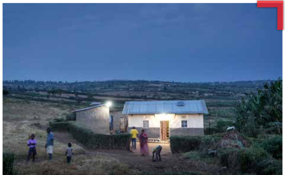
Solarsysteme von Mobisol bieten saubere Energie für bis zu 20 Leuchten

Mobisol konnte in den letzten vier Jahren nahezu 30.000 ruandische Haushalte elektrifizieren. Folglich profitieren aktuell mehr als 150.000 Ruander von sauberem