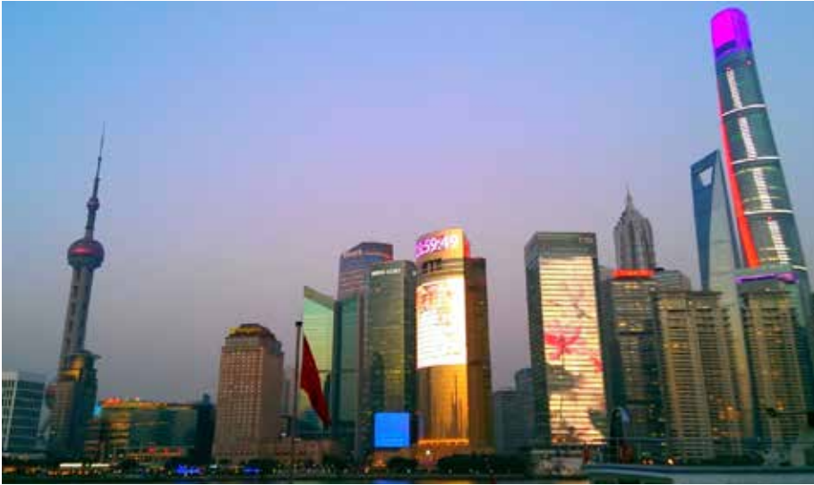
Moderne Megacities mit mehreren Millionen Einwohnern gibt es in ganz China (Skyline Shanghais)

andisch-chinesische Handel stetig und macht Ruanda unabhängiger vom bisherigen Exportmarkt Europa. Auch Paul Kagame begrüßt die Partnerschaft, da sie die heimische Infrastruktur stärkt, frisches Kapital ins Land bringt und ihn unabhängiger von Zahlungen und Druck westlicher Staaten macht.