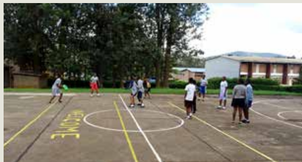
Schüler beim Ultimate Frisbee spielen

bee unterstützen. Die Schülerinnen nahmen die ihnen völlig unbekannte Sportart auch sehr gut an. Durch eine großzügige Spende von „Sport 2000 Deutschland“ wurde das Projekt mit Material unterstützt. Neben Schülern war auch der Sportlehrer begeistert und plant bereits schon die Teilnahme an Turnieren und dem Eintritt in die Liga. Ein erstes klassenübergreifendes Spiel soll Ende Juni stattfinden.