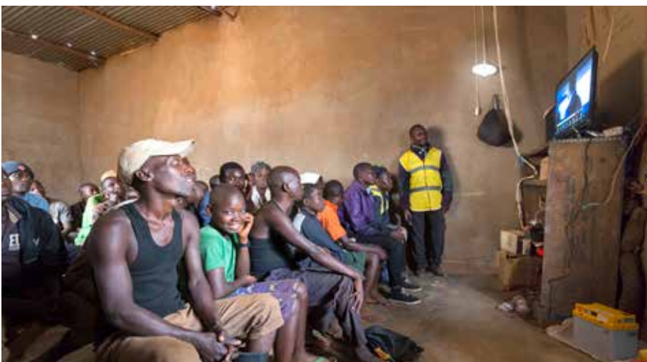
Ein Drittel aller Mobisol Kunden nutzt das Solarsystem für kleine Geschäftsmodelle. Hier zum Beispiel ein Village Cinema

dienst hat es Mobisol geschafft, dass die Kunden seinen Angeboten vertrauen. Zudem ist die Nachhaltigkeit der Technik gewährleistet. Hierfür baut Mobisol in den Projektländern unter Berücksichtigung der Gegebenheiten vor Ort ein Netzwerk gut ausgebildeter und zertifizierter Servicetechniker und Vertriebsmitarbeiter auf. Diese durchlaufen ein spezielles Training in der eigens von Mobisol gegründeten Mobisol Akademie. Über 200 lokale Mitarbeiter und elf Mobishops hat das Unternehmen aktuell in Ruanda. Tendenz steigend. Darüber hinaus wachsen die Kooperationen mit sogenannten „Third Party Distributoren“, die in Ihren Shops Mobisolprodukte anbieten.