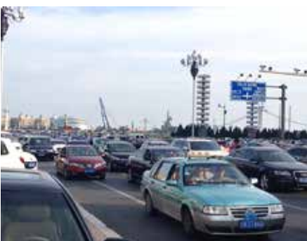
Der VW Santana war das erste in China produzierte Modell und wird seit 1984 weiterhin genutzt (Xinghai Platz in Dalian)

So steht China bereits seit der Asien-Afrika-Konferenz in Bandung (Indonesien) im Jahr 1955 mit verschiedenen afrikanischen Staaten in Kontakt. Diese Partnerschaften wurden seit 2000 auch mit dem Forum für China-Afrika-Kooperation institutionalisiert. Das letzte Treffen fand übrigens vom 3. bis 4. September 2018 statt und beschäftigte sich mit dem Thema Sicherheit und insbesondere Rüstungsexporte. Neben der Sicherheit spielen weitere Themen eine wichtige Rolle in den sino-afrikanischen Beziehungen. So sichert sich China durch die politische und wirtschaftliche Zusammenarbeit mit Afrika einen internationalen Rückhalt in multilateralen Organisationen wie den Vereinten Nationen. Die 53 afrikanischen Staaten stellen einen wichtigen Stimmenanteil dar. Neben den politischen Vorteilen bietet der afrikanische Kontinent auch attraktive Absatzmärkte und Produktionsstandorte. Der chinesische Staat ist auch sehr aktiv in Ruanda und pflegt seit 1971 eine Partnerschaft. Gerade die technische Zusammenarbeit spielt eine wichtige Rolle und zeigt sich zum Beispiel im Ausbau des Reisanbaus und den damit verbundenen Bewässerungssystemen. Weiterhin gibt es gegenseitige Besuche der Präsidenten bzw. von Mandatsträgern, welche oft in Abkommen zur wirtschaftlichen und technologischen Kooperation münden. Größtenteils sind die Projekte nicht sehr umfangreich und beschränken sich auf den Straßenbau. Jedoch wächst der ru-