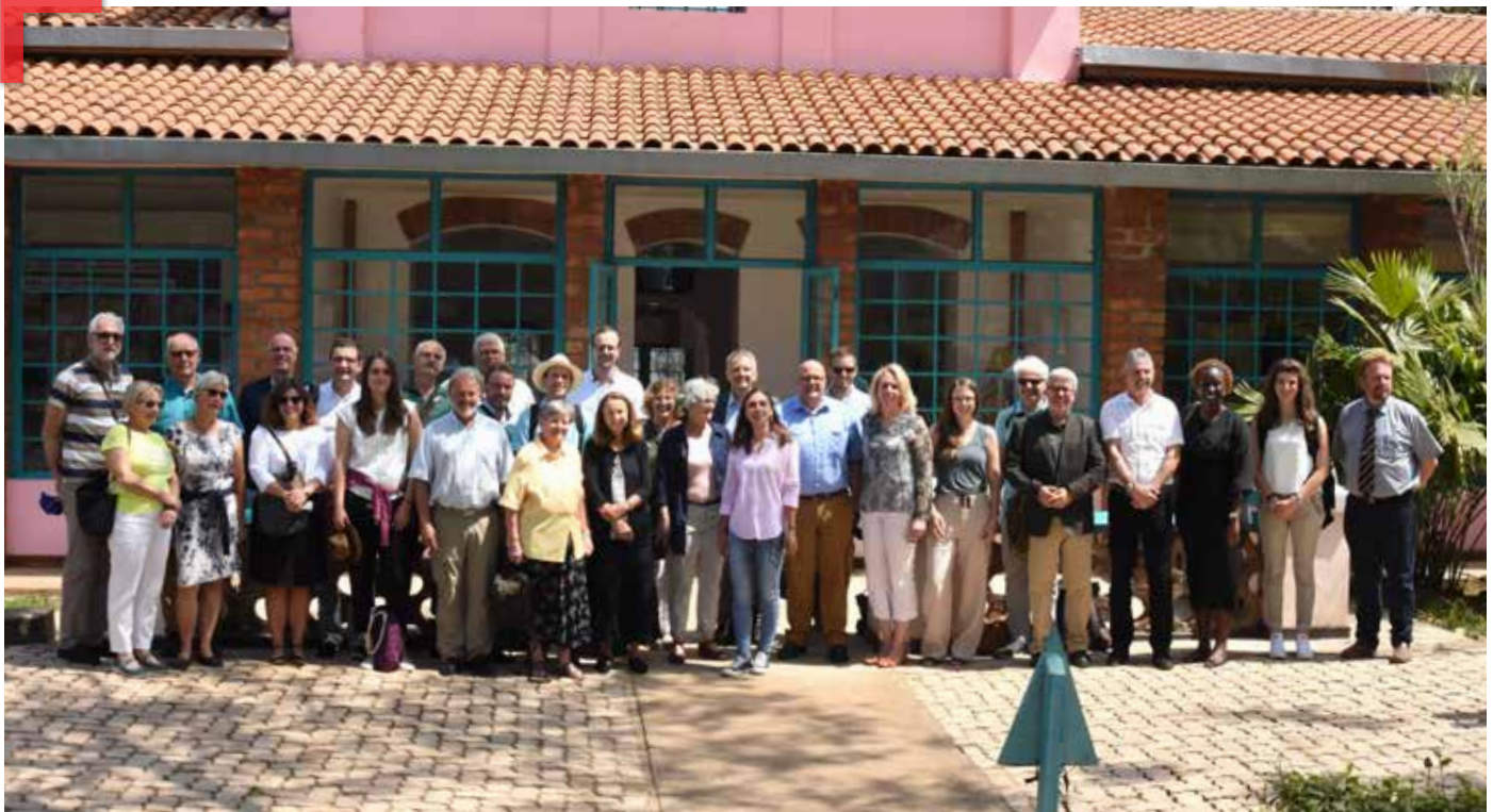
Die Delegation beim Besuch den Kandt-Hauses in Kigali

Bei einem Abschlussworkshop in Kigali wurden schließlich die Erkenntnisse der Woche diskutiert, relevante Themen für den gegenseitigen Austausch identifiziert und konkrete Aktionspläne für den weiteren Projektverlauf formuliert. Diese sind je nach Partnerschaft ganz unterschiedlich und reichen von guter Regierungsführung und Bürgerbeteiligung bis hin zu Stadtplanung, erneuerbaren Energien, Wasserversorgung oder Abfallmanagement. Für jede Kommune / Institution wurde ein verantwortlicher Ansprechpartner benannt, der die weitere Kommunikation begleitet.