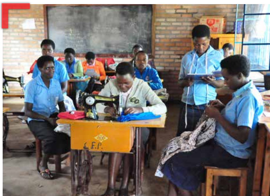
Die Länderpartnerschaft ist auch in ruandischen Berufsschulen tätig.

„Entsprechend diesem Beschluss bitten sie [die Deutschen Länder] die Bundesre-