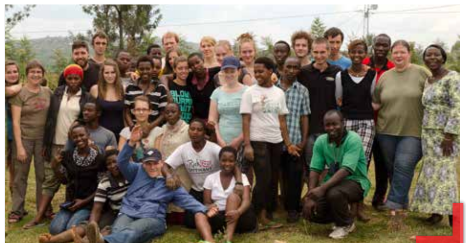
Internationale Jugendbegegnung mit Jugendlichen von Haus Wasserburg, der KSJ Trier und aus der Pfarrei Matimba

Kontaktieren Sie mich gerne, wenn Sie Fragen und/oder Anregungen haben: E-Mail: sahinkuye@haus-wasserburg.de Telefon: 0261 6408 115