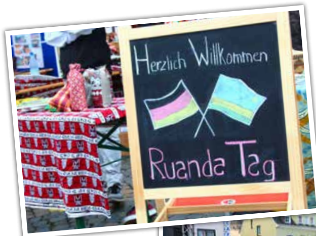
Foto-Nachlese des Ruanda Tags 2018 in Mayen