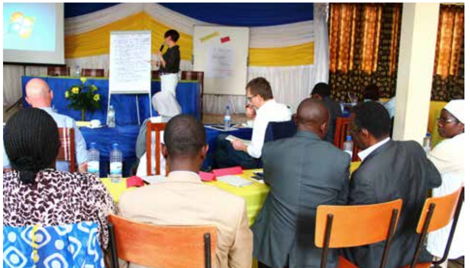
Gemeinsames Arbeiten auf dem Treffen der Netzwerke in Kigali. In Workshops wurden diverse Themenfelder bearbeitet

nikation zwischen ruandischen und rheinland-pfälzischen Partnern diskutiert. Dabei ergaben sich zahlreiche Erkenntnisse und jede Menge Ideen für die künftige Zusammenarbeit auf allen Ebenen. Von dieser Arbeit werden ruandische und rheinland-pfälzische Kinder in Zukunft profitieren und die Arbeit für Menschen mit Behinderungen wird im Rahmen der Partnerschaft auch in den kommenden Jahren eine wichtige Position einnehmen.