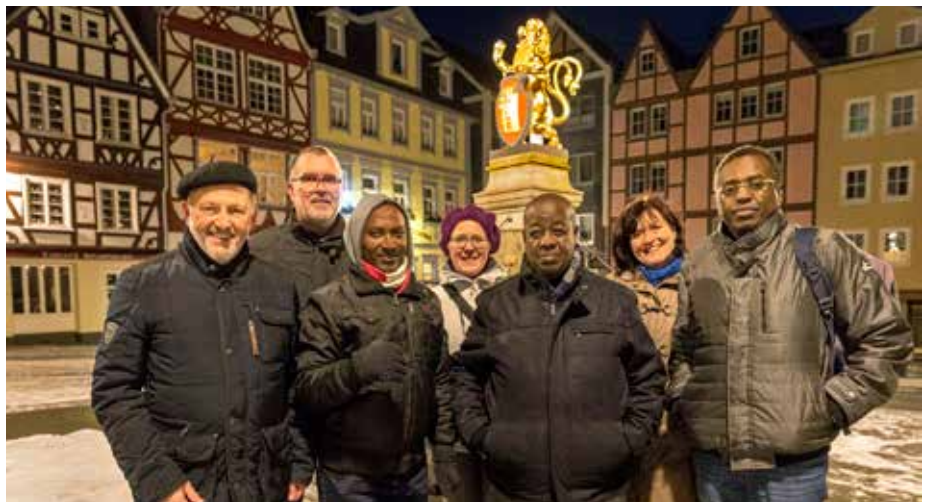
Delegationsmitglieder aus der Klimapartnerschaft Hachenburg-Gisagara bei ihrer 1. Entsendung in Hachenburg

Dieses Projekt will das umfangreiche kommunale Know-how auf dem Gebiet Klimaschutz und Klimafolgenanpassung nutzen und gegenseitige Kooperationen fördern. Dafür arbeiten eine deutsche Kommune und eine Kommune aus dem Globalen Süden regelmäßig und strukturiert zusammen. Möglich ist, sowohl auf einer bestehenden Städtepartnerschaft aufzubauen und diese um neue thematische Bereiche zu erweitern, als auch eine Themenpartnerschaft von zwei interessierten Kommunen neu zu gründen. Die Servicestelle Kommunen in der Einen Welt (SKEW) von Engagement Global in Kooperation mit der Landesarbeitsgemeinschaft Agenda 21 NRW (LAG 21) unterstützt Kommunen bei der systema-