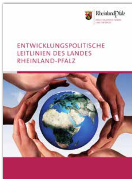
Die Leitlinien des Landes Rheinland-Pfalz

So formuliert zum Beispiel die rheinland-pfälzische Landesregierung in ihren entwicklungspolitischen Leitlinien: „Als wichtiger Standort der Land- und Forst-