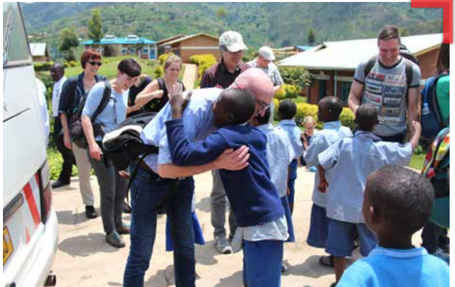
Herzlicher Empfang der Gruppe durch die Kinder des Zentrums Komera

Diese Herausforderungen waren dann auch ein großes Thema auf dem Treffen der beiden Netzwerke am letzten offiziellen Tag der Reise. Hier wurden in Arbeitsgruppen die nächsten Schritte der Netzwerke sowie die individuelle Kommu-