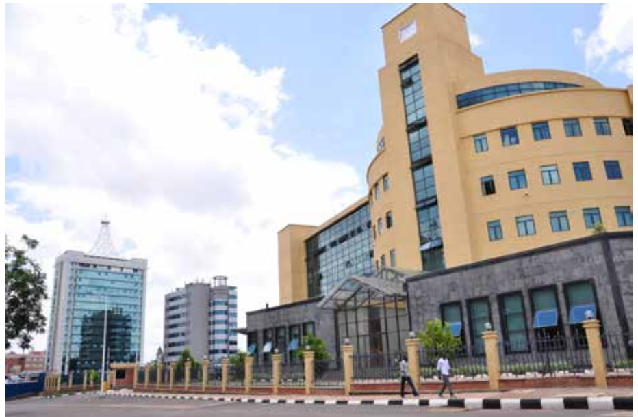
Die ruandische Hauptstadt Kigali hat einiges zu bieten und gilt als sauberste Hauptstadt Afrikas

Die Projekte werden von der Servicestelle Kommunen in der Einen Welt von