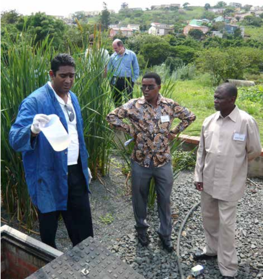
Exkursion zur Fließgewässerreinigung bei Durban im Rahmen des 1. Netzwerktreffens in Durban

identifiziert. Ein solcher Masterplan soll auch in Kinigi erstellt werden, dann können konkrete Projektideen weiterentwickelt werden. Weitere Delegationsreisen sollen Aufschluss über die Voraussetzungen geben sowie Herausforderungen und Potenziale vor Ort identifizieren und der Entwicklung von Projektideen dienen. Im Anschluss daran erfolgt die Erarbeitung des konkreten Handlungsprogramms für den Klimaschutz.