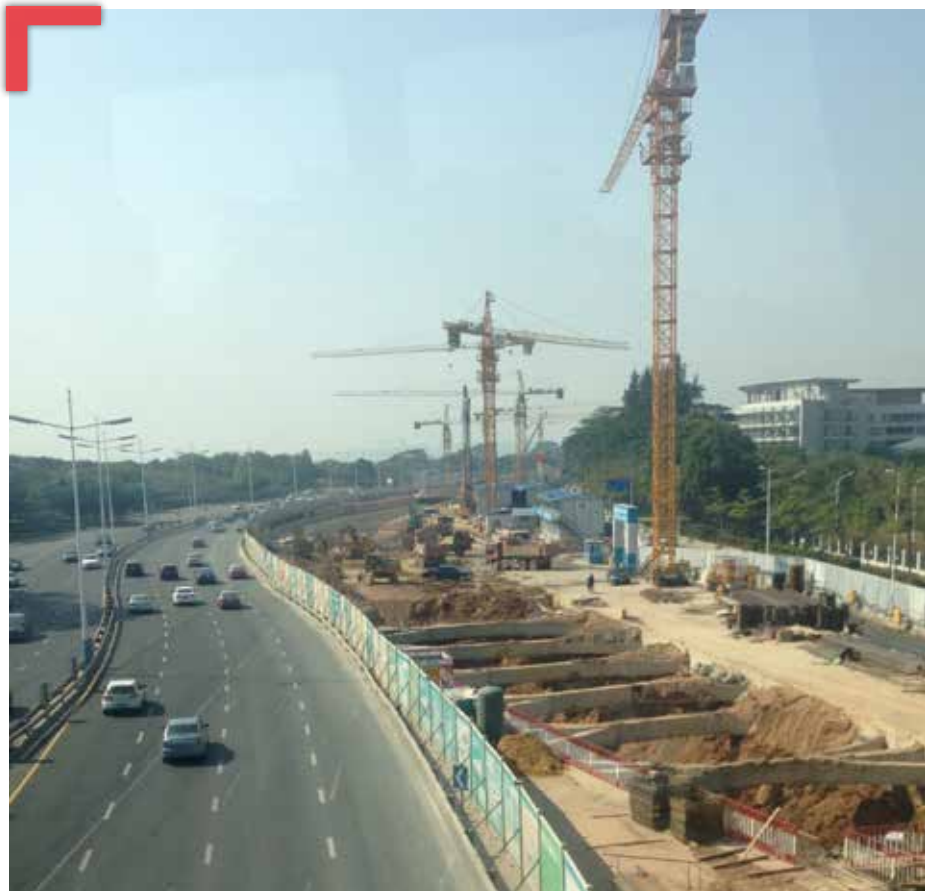
Chinas Wachstum ist enorm - auch zu Lasten der Umwelt (Baustelle in Shenzhen)

China gilt auf dem afrikanischen Kontinent bereits als der größte Investor im Bereich der Infrastruktur und plant von 2015 bis Ende 2018 ein Investitionsvolumen von 60 Milliarden Euro in Afrika. Die Triebkraft für diese hohen Investitionen ist Chinas Hunger nach Rohstoffen. Das starke Wirtschaftswachstum fordert seinen Tribut und muss durch eine ständige Zufuhr von Rohstoffen aufrechterhalten werden. Den Zugang in Afrika sichert sich Peking durch die unter dem als „Angola-Modell“