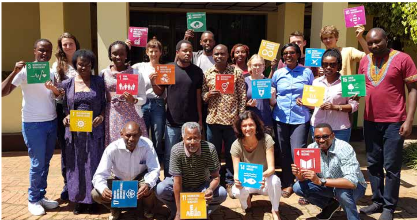
Die Ziele sind auch Grundlage für die Arbeit der Partnerschaft.

wicklungsländer, Schwellenländer und Industriestaaten, alle müssen im Rahmen ihrer Möglichkeiten einen Beitrag leisten. Die Agenda 2030 steht für ein neues globales Verständnis von Wohlstand und Entwicklung, das über die bisherige Betrachtung von Pro-Kopf-Einkommen hinausreicht. Es geht vor allem um eine Umgestaltung von Volkswirtschaften hin zu nachhaltiger Entwicklung, beispielsweise durch verantwortungsvolle Konsum- und Produktionsmuster sowie saubere und erschwingliche Energie. Denn Klimapolitik, nachhaltige Entwicklung und Armutsbekämpfung sind untrennbar miteinander verbunden.