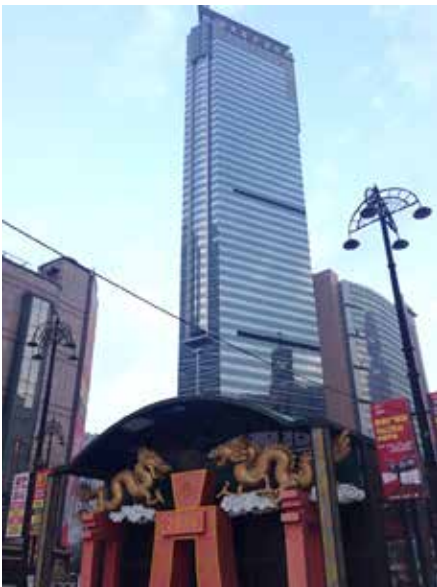
Chinas Sprung in die Moderne ist unverkennbar und hat meist mit Nachhaltigkeit wenig gemein (City Tower in Dalian)

Ganz bewusst hat die chinesische Regierung in ihrem Fünfjahresplan für wirtschaftliche und soziale Entwicklung die SDGs aufgenommen. Dies ist ein Wendepunkt in der politischen und wirtschaftlichen Orientierung. Nun soll es mehr in Richtung umweltfreundlicherer Entwicklung und nicht nur um pures Wachstum gehen. Peking sieht sich nun als treibende Kraft zur Erreichung der globalen Entwicklungsziele und versucht dabei die Süd-Süd Partnerschaften zu nutzen. Prämisse ist hierbei, die universellen Nachhaltigkeitsziele zu fördern, aber das Recht auf Entwicklung nicht zu beeinträchtigen. Nach der Auffassung Chinas sollten die Industrieländer jedoch nicht aus ihrer Verpflichtung entlassen werden. Vielmehr geht die chinesische Kritik auch soweit, dass Industrienationen aufhören sollten zu glauben, vermeintlich weniger entwickelte Länder belehren zu müssen und sich aus der Debatte der Erreichung der SDGs herauszunehmen. Die SDGs geben dabei eine Richtschnur vor und sollen alle Länder gleichermaßen stärken. Die Ziele gelten für alle und zeigen eine gemeinsame aber auch differenzierte Verantwortung auf.