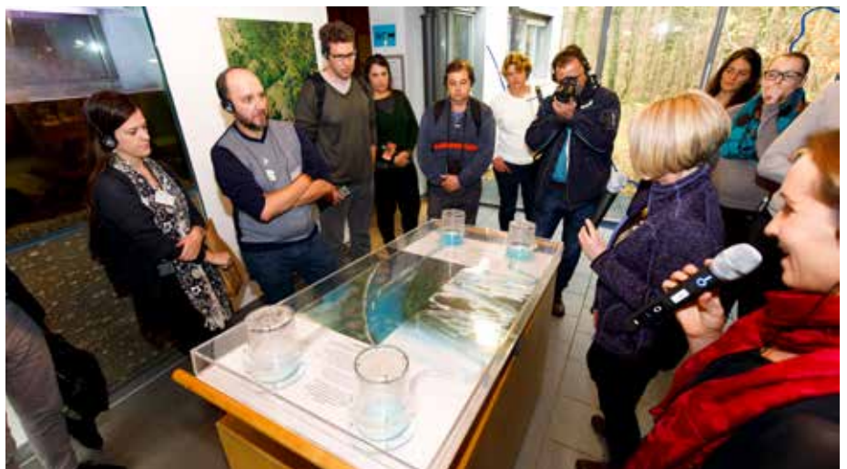
Exkursion zum Natursschutzzentrum Rappenwörth (bei Karlsruhe) im Rahmen des Internationalen Workshops der Handlungsprogramme der Klimapartnerschaften der 4. Projektphase

tischen Integration der Themen Klimaschutz und Klimafolgenanpassung in die Partnerschaftsarbeit.