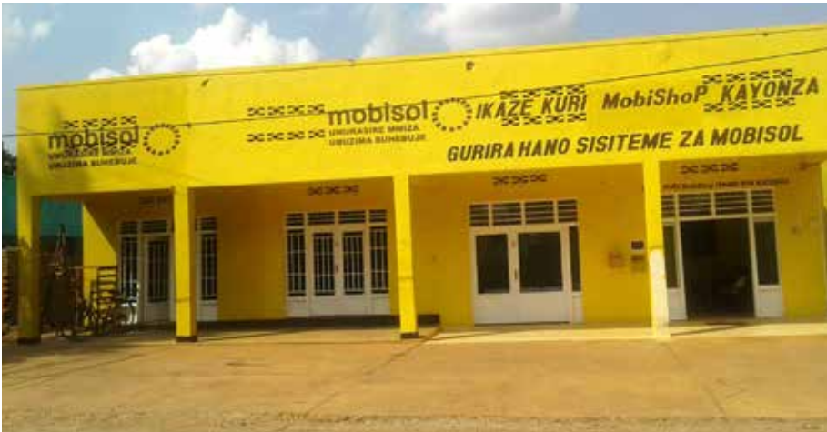
MobiShop in Hamagara: Elf MobiShops werden aktuell in Ruanda betrieben. Über 50 sind es in ganz Ostafrika

Mobisol ist überzeugt davon, dass Afrikas Energieversorgung größtenteils dezentral erfolgen kann, dabei bietet die Elektrifizierung ländlicher Gebiete einen der Schlüsselfaktoren für sozioökonomische Entwicklung.