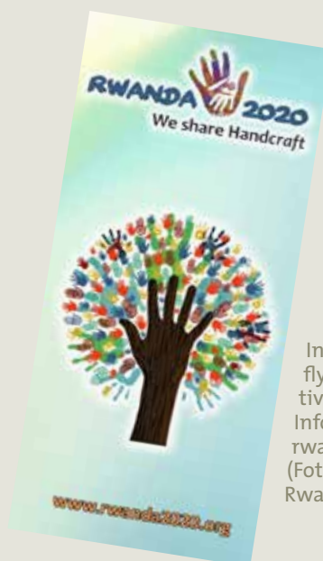
Informationsflyer der Initiative und weitere Infos unter www.rwanda2020.org

in 2020 erstmals ein Gewerke mit 220 jungen europäischen Handwerker*innen und Auszubildenden verschiedenster Bereiche nach Ruanda zu reisen und mit ruandischen Berufsschülern zusammenzuarbeiten. Dabei sollen Reparaturarbeiten an Bildungseinrichtungen vorgenommen werden. Eine weitere Innovation werden die gemeinsamen Arbeiten an einem Junior Talent House of Handcraft, ein europäisch-ruandisches Informations- & Begegnungszentrum für das Handwerk, darstellen. Weitere Informationen zum Vorhaben, den Menschen dahinter und die Ziele finden Sie unter: https://www.rwanda2020.org/