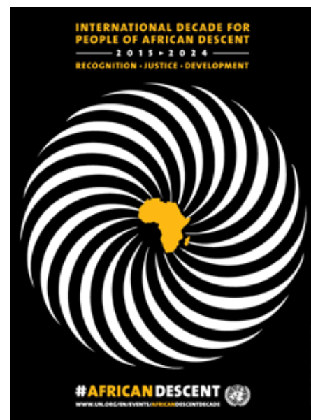
Logo-Dekade von den Vereinte Nationen

Die Dekade ist ein wichtiges Instrument, Veränderungen auf politischer Ebene herbeizuführen. Trotzdem ist sie der breiten Öffentlichkeit zwei Jahre nach Eröffnung weitestgehend unbekannt. An dieser Stelle können bürgerliche Initiativen, insbesondere migrantisch-diasporische, einen wichtigen Beitrag für den Erfolg der Dekade leisten, indem sie deren Umsetzung von den politischen