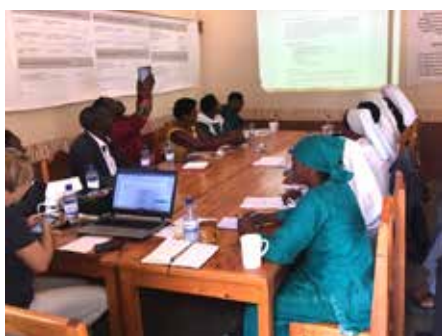
Am Nachmittag wurde das zukünftige Vorgehen des Netzwerks besprochen

The impact that the network members in Rwanda has is, for me, positive because now I can see the strong collaboration between our centers. The more meetings we have -where all our centers head teachers come together as one family to share and discuss all the issues related to our services in our various places of activities and apostolate - the more it is improved. ■