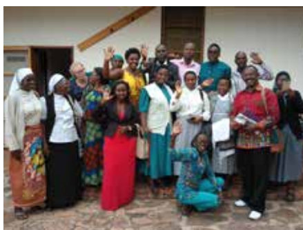
Das ruandische Sugira Netzwerk bei einem Treffen im Koordinationsbüro in Kigali