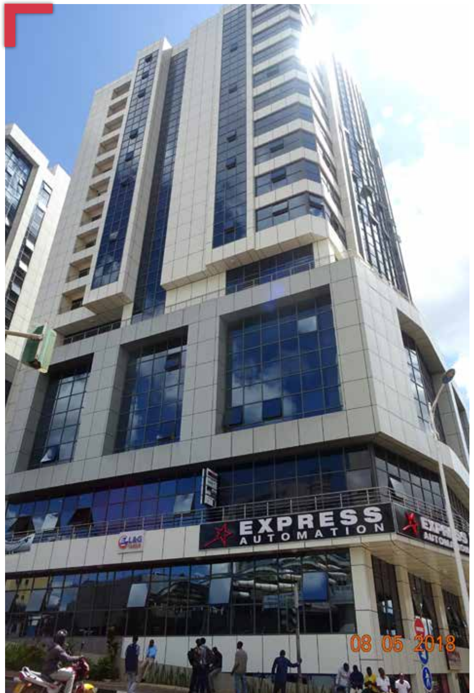
Sitz des SDG Center for Africa in Kigali

Der Vorstand des SDG Centers setzt sich aus Staatsoberhäuptern, Geschäftsführern von großen Unternehmen und bekannten Aktivisten zusammen. Die bekanntesten Vorstandsvorsitzenden sind unter anderem der ruandische Präsident Paul Kagame und der nigerianische Unternehmer Aliko Dangote, Chef des größten industriellen Mischkonzerns Westafrikas.