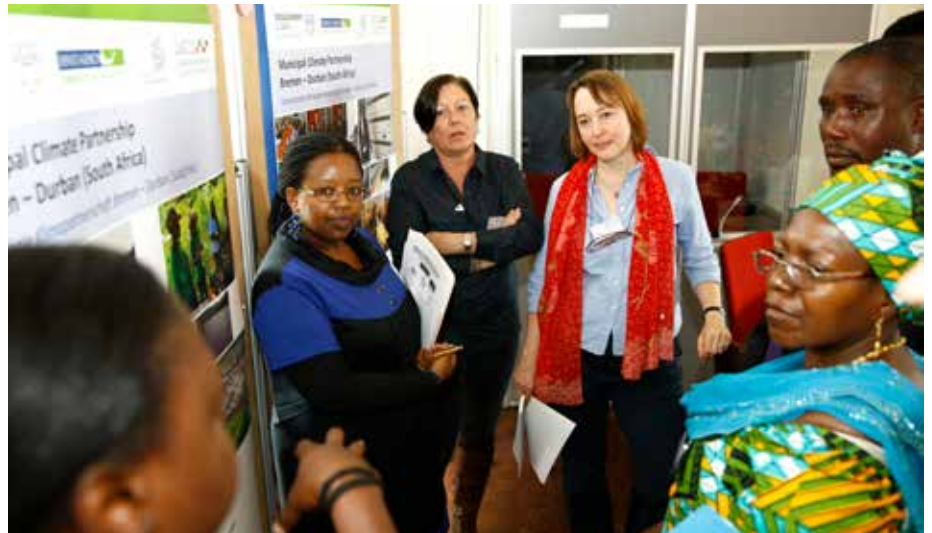
Exkursion zum Natursschutzzentrum Rappenwörth (bei Karlsruhe) im Rahmen des Internationalen Workshops der Handlungsprogramme der Klimapartnerschaften der 4. Projektphase

Das Engagement der kommunalen Partner kann nicht hoch genug geschätzt werden, denn nur durch das engagierte Zusammenwirken der verschiedenen