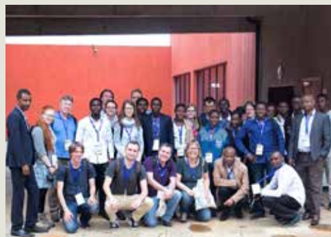
Gruppenbild bei der Führung über den Universitätscampus

„Müde und erschöpft, aber voller neuer Eindrücke und Erfahrungen landeten wir wieder in Frankfurt und sind sehr dankbar für alles, was wir erleben durften: Wir kamen als Gäste und gingen als Freunde“ lautete das Resümee der Studierenden in ihrem Reisebericht.