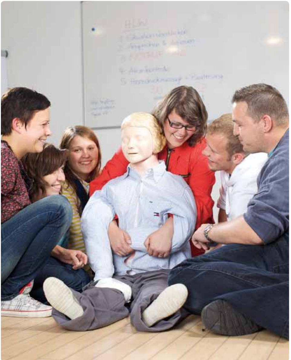
Hilfe, wann immer sie gebraucht wird: Beim Berliner Jugendrotkreuz engagieren sich junge Menschen nicht nur bei der Ersten Hilfe, sondern auch in sozialen Bereichen.