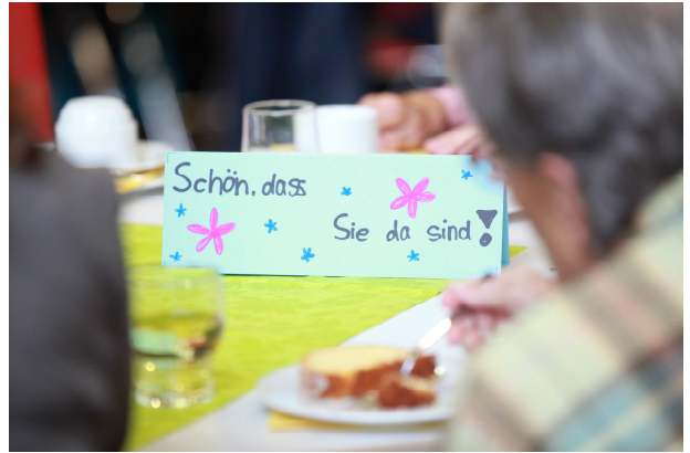
Schüler und Senioren im Gespräch