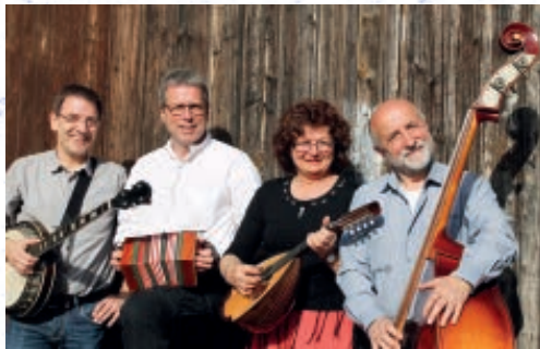
„New Paltz Band“

Pennsylvanisch - deutsche Mundart, viel Musik „uff pälzisch“ und eine Menge Informationen, das verspre- chen die Texte und Lieder rund um die Migration von Pfälzern.