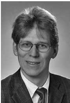
Von Dr. Dirk Schneider

Die amtlichen Steuerstatistiken unterliegen seit mehreren Jahren einem grundlegenden Wandel. Im Jahr 2006 wurde eine Neukonzeption des Systems der Steuerstatistiken initiiert, und zwar mit dem Ziel, ein integriertes Steuerstatistisches Gesamtsystem auf der Grundlage jährlicher Bundesstatistiken zu schaffen.