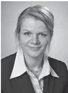
Von Bettina Link

Die Hochschulen verzeichnen seit 15 Jahren einen kräftigen Anstieg der Studierendenzahlen. Ursächlich hierfür sind die demografische Entwicklung und die anhaltend steigenden Studienberechtigtenzahlen. Darüber hinaus erhöhten bis zum Jahr 2013 immer wieder doppelte Abiturjahrgänge in einigen Bundesländern die Studierendenzahlen zusätzlich. Für die Hochschulen ergab sich damit die Notwendigkeit eines massiven Ausbaus der Studienkapazitäten. Zudem müssen sie ihre Bildungsangebote an eine in Bezug auf Herkunft, Alter und Vorbildung zunehmend heterogener werdende Studierendenschaft anpassen. Die Daten und Kennzahlen der amtlichen Hochschulstatistik geben Hinweise darauf, wie erfolgreich die Hochschulen mit den aktuellen Herausforderungen umgehen.