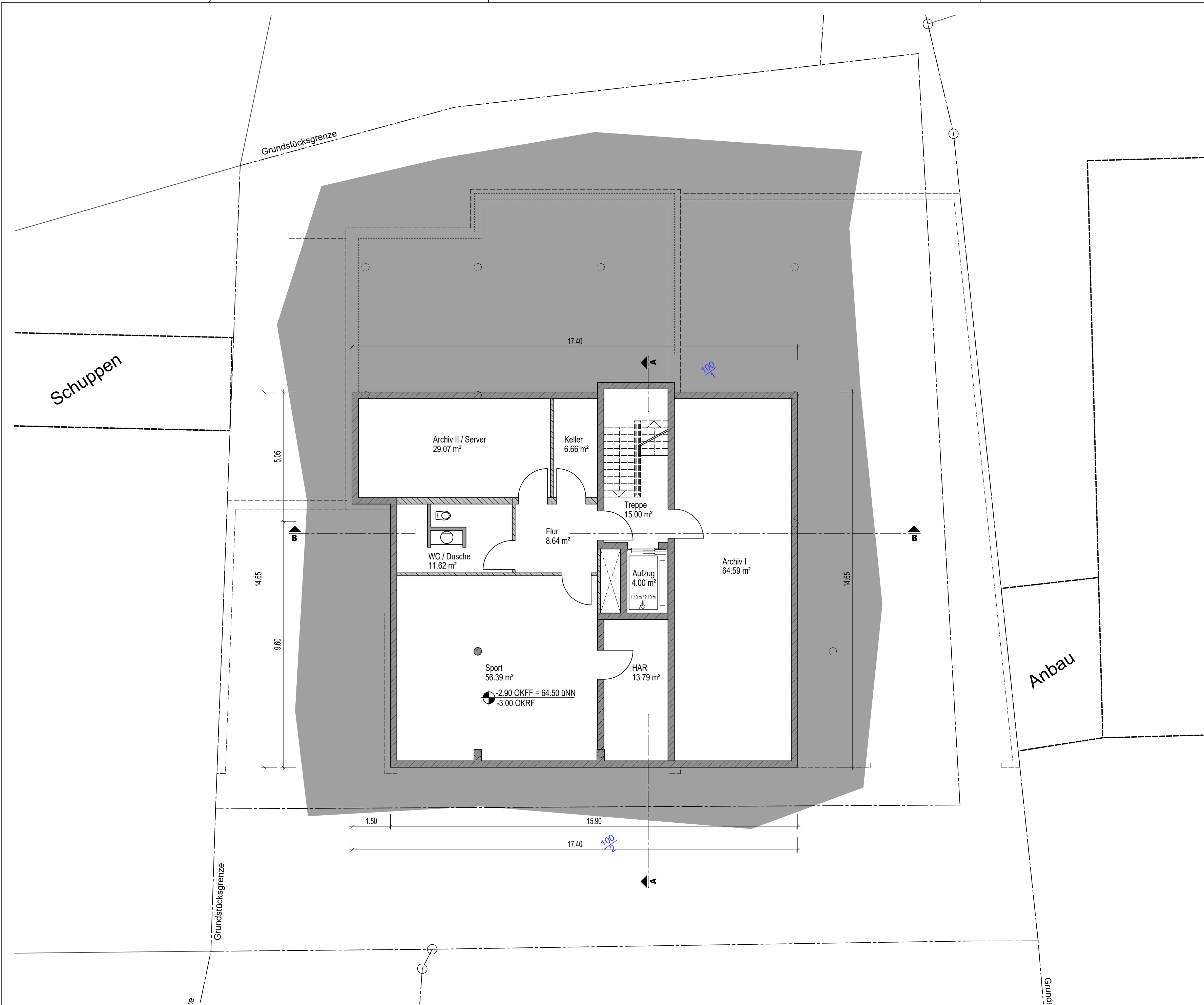
Kellergeschoss M 1:100

Die zeichnerisch dargestellten Innenraumaufteilungen, Raumfunktionen und m²-Angaben sind im Rahmen des VEP nicht bindend.