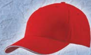
Baseballcaps mit Druck ab 5,99 € / Stück