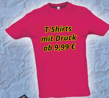
T-Shirts mit Druck ab 9,99 €