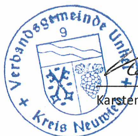
Karsten Fehr, Bürgermeister

Die Haus- und Badeordnung gilt für den allgemeinen Badebetrieb. Bei Sonderveranstaltungen sowie dem Schul- und Vereinsschwimmen können von dieser Haus- und Badeordnung im Einzelfall Ausnahmen oder besondere Verfahrensweisen –auch kurzfristig- zugelassen werden, ohne dass es einer besonderen Aufhebung der Haus- und Badeordnung bedarf.